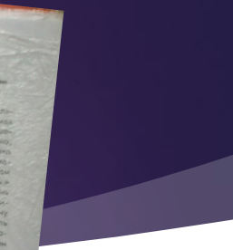
иногда. Ты всегда была для меня в трудную