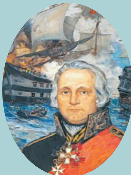
Фёдор Фёдорович Ушаков

Великие деятели культуры и науки, знаменитые воины России – Ломоносов, Державин, Пушкин, Достоевский, Суворов, Ушаков в своей жизни соединяли служение народу и России с ее духовными ориентирами.