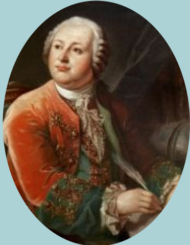
Михаил Васильевич Ломоносов