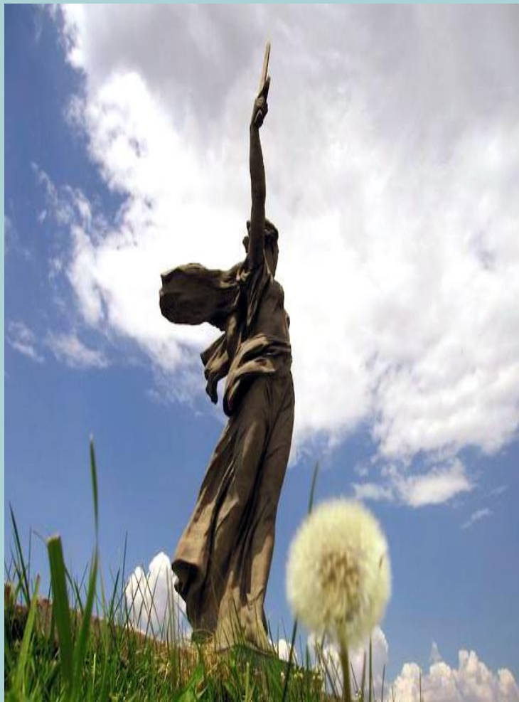
Скульптура Родина Мать