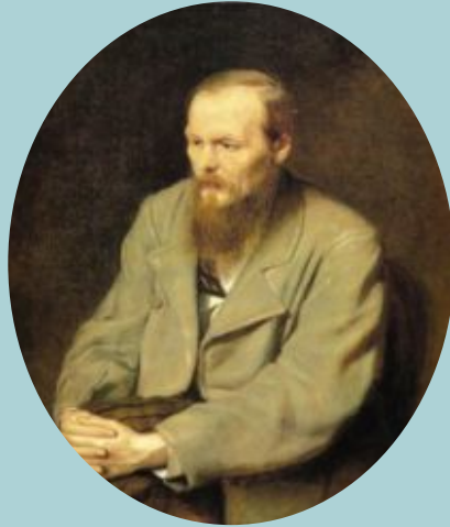
Фёдор Михайлович Достоевский