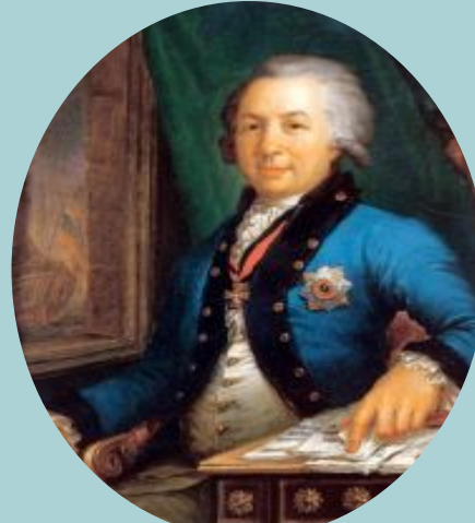
Гавриил Романович Державин