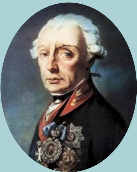
Александр Васильевич Суворов