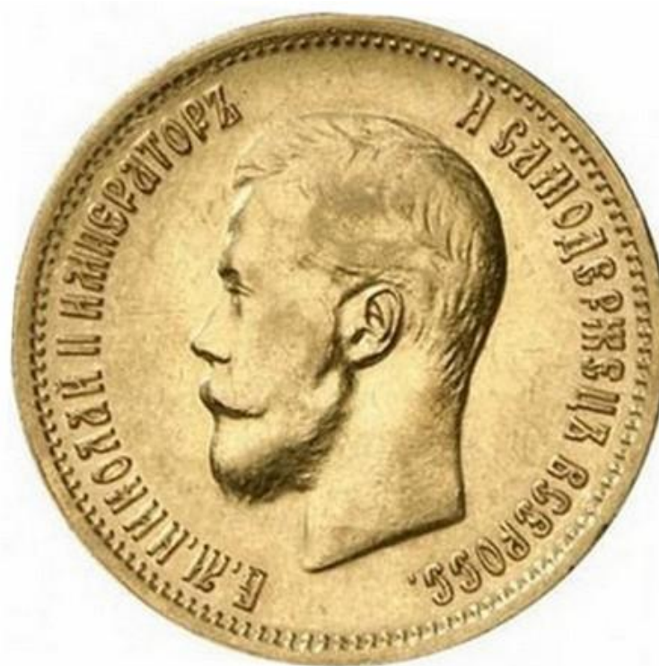
Деньги России 19-20 веков