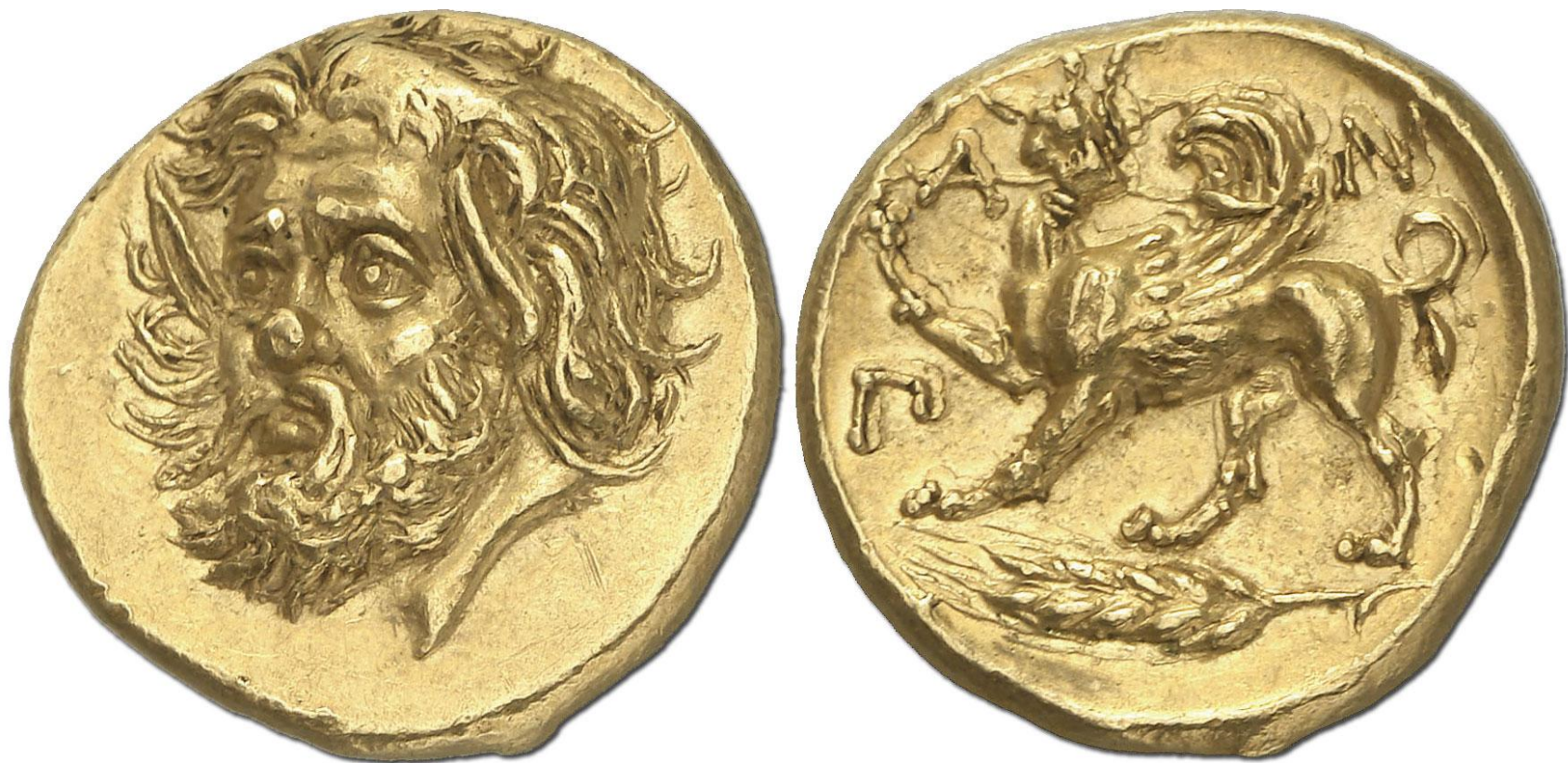
Деньги древней Греции