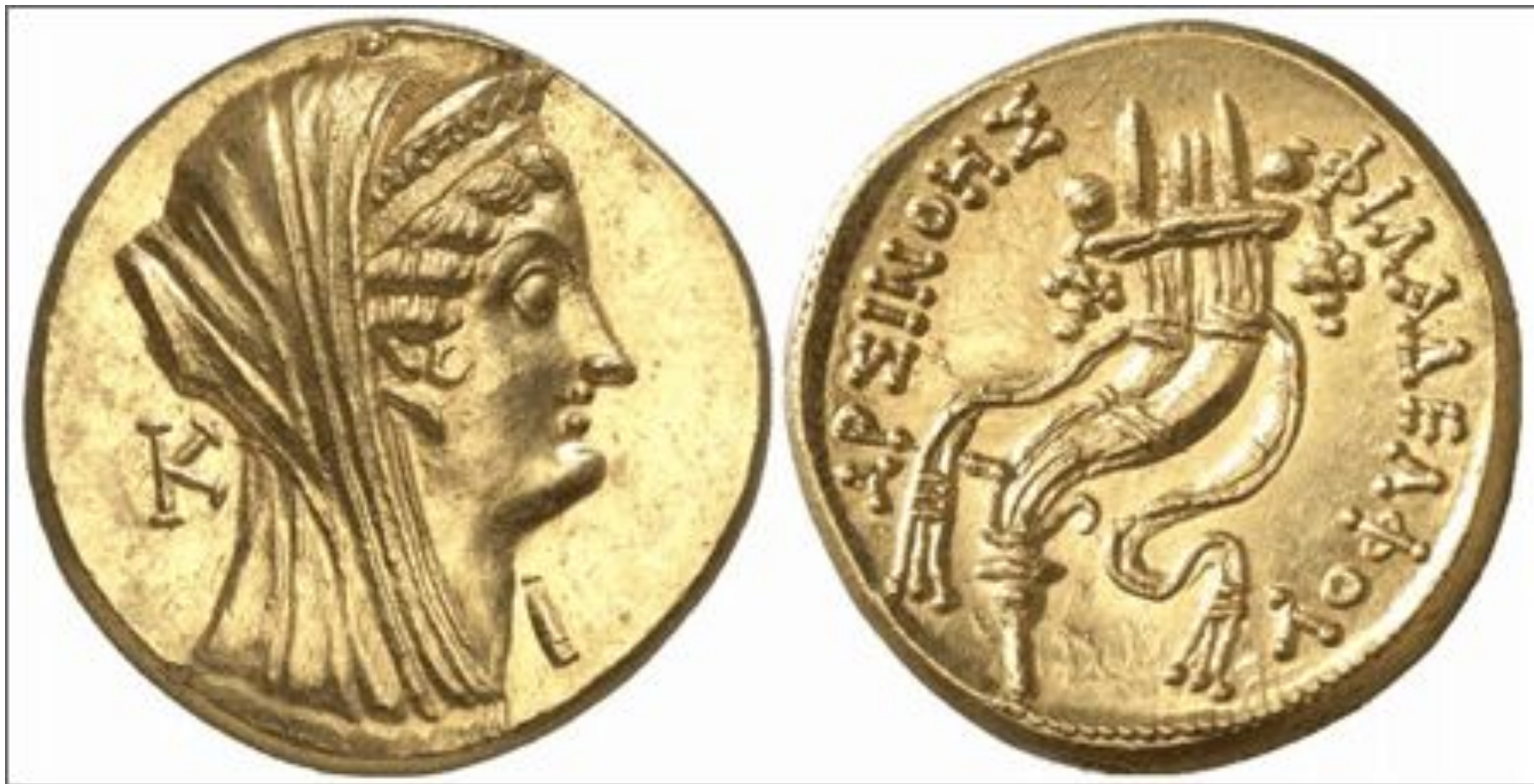
Первые золотые монеты