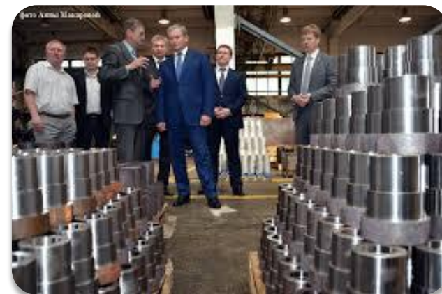
Кадры для ОПК