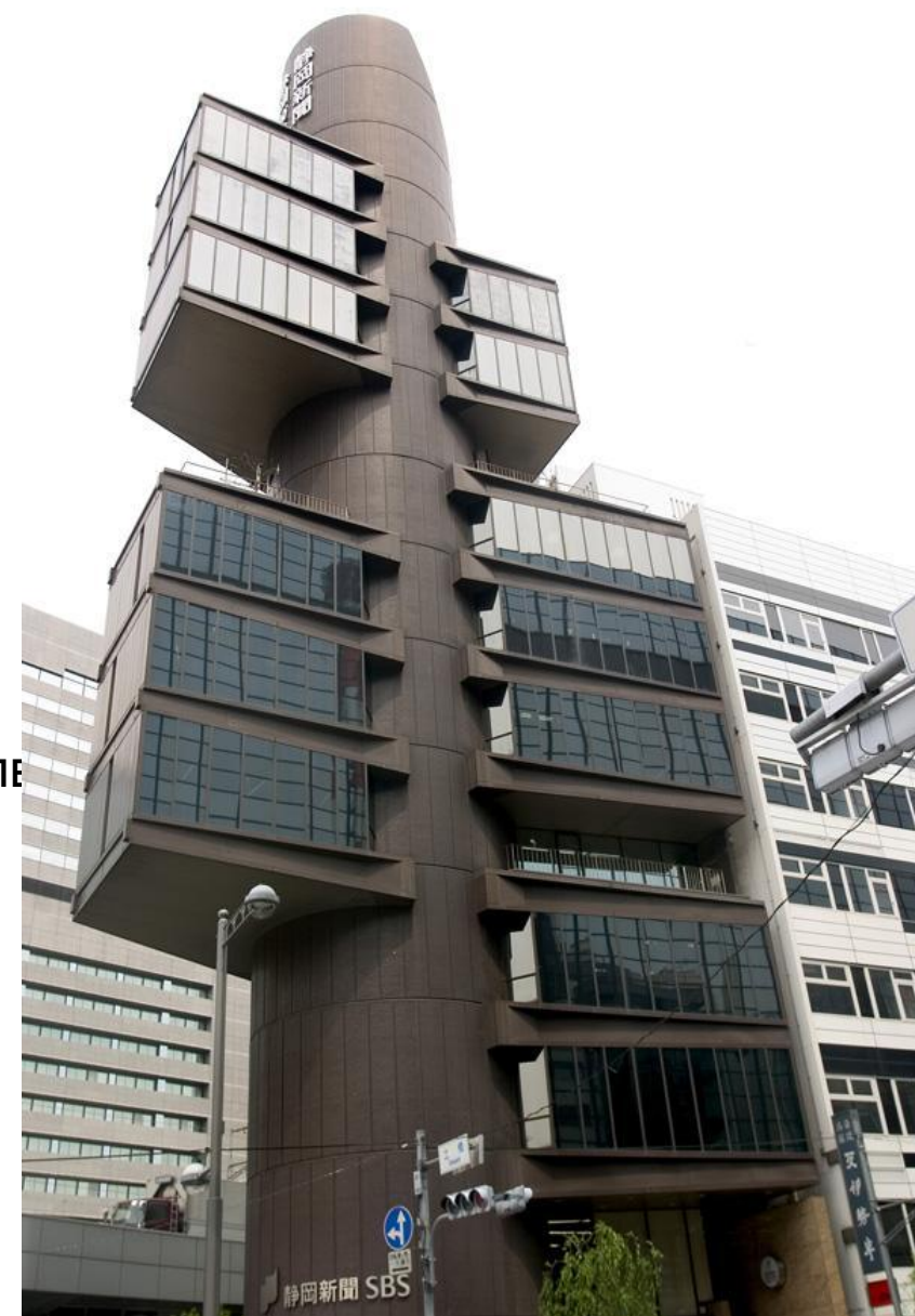
Пресс-центр в Сидзуоке