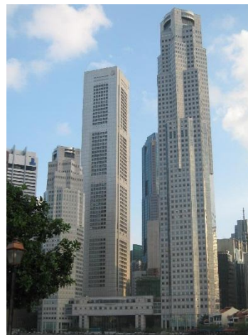
Площадь UOB, Сингапур (1992)