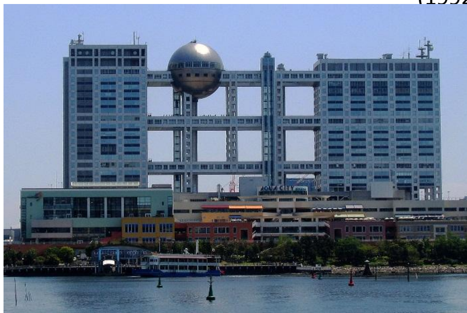
Здание Fuji Television в Одайбе, Токио (1996)