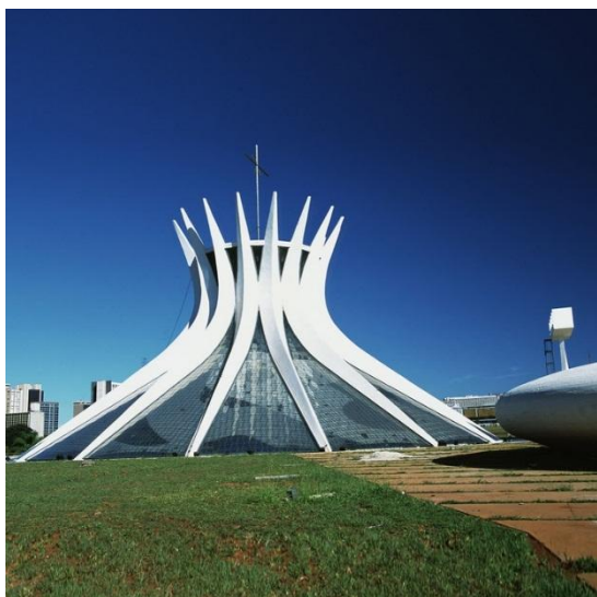
Кафедральный собор, Бразилиа, Бразилия. 1970