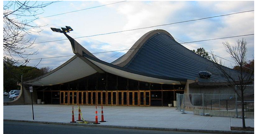
Каток «Цельский кит», Нью-Хейвен, США, 1958