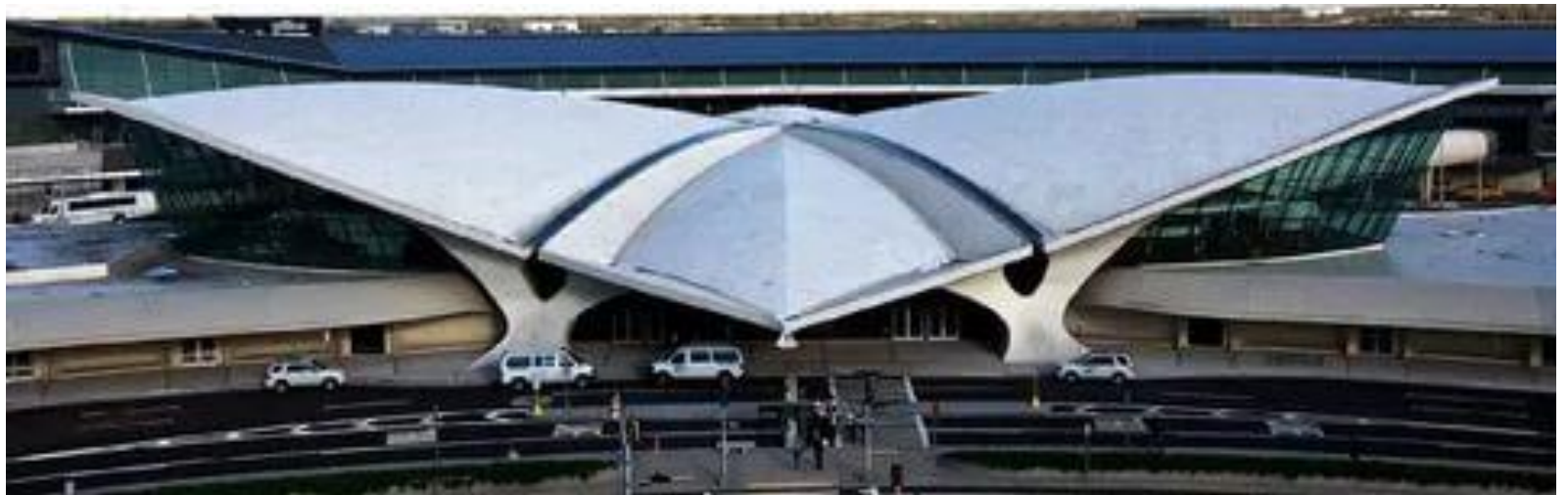
Терминал TWA в аэропорту Кеннеди, New-york, 1962 г.