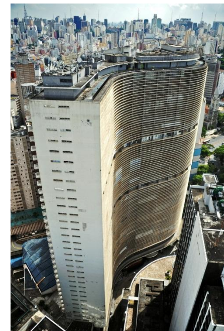
Резиденция Копан, Сан-Пауло, Бразилия.1966