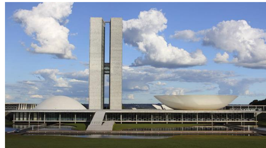
Дворец Национального конгресса Бразилии, Бразилиа