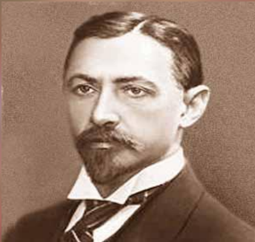
ИВАН АЛЕКСЕЕВИЧ БУНИН 10 (22) ОКТЯБРЯ 1870 Г.-8 НОЯБРЯ 1953 Г.