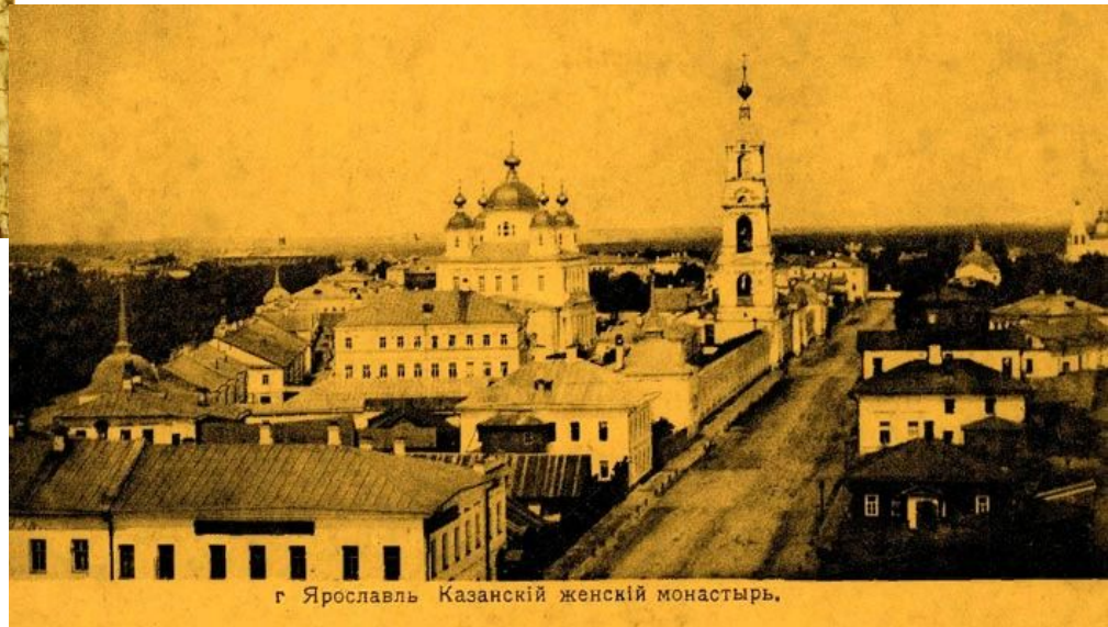
г. Ярославль Казанский женский монастырь.