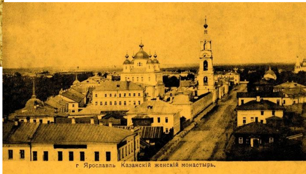
г. Ярославль Казанский женский монастырь.