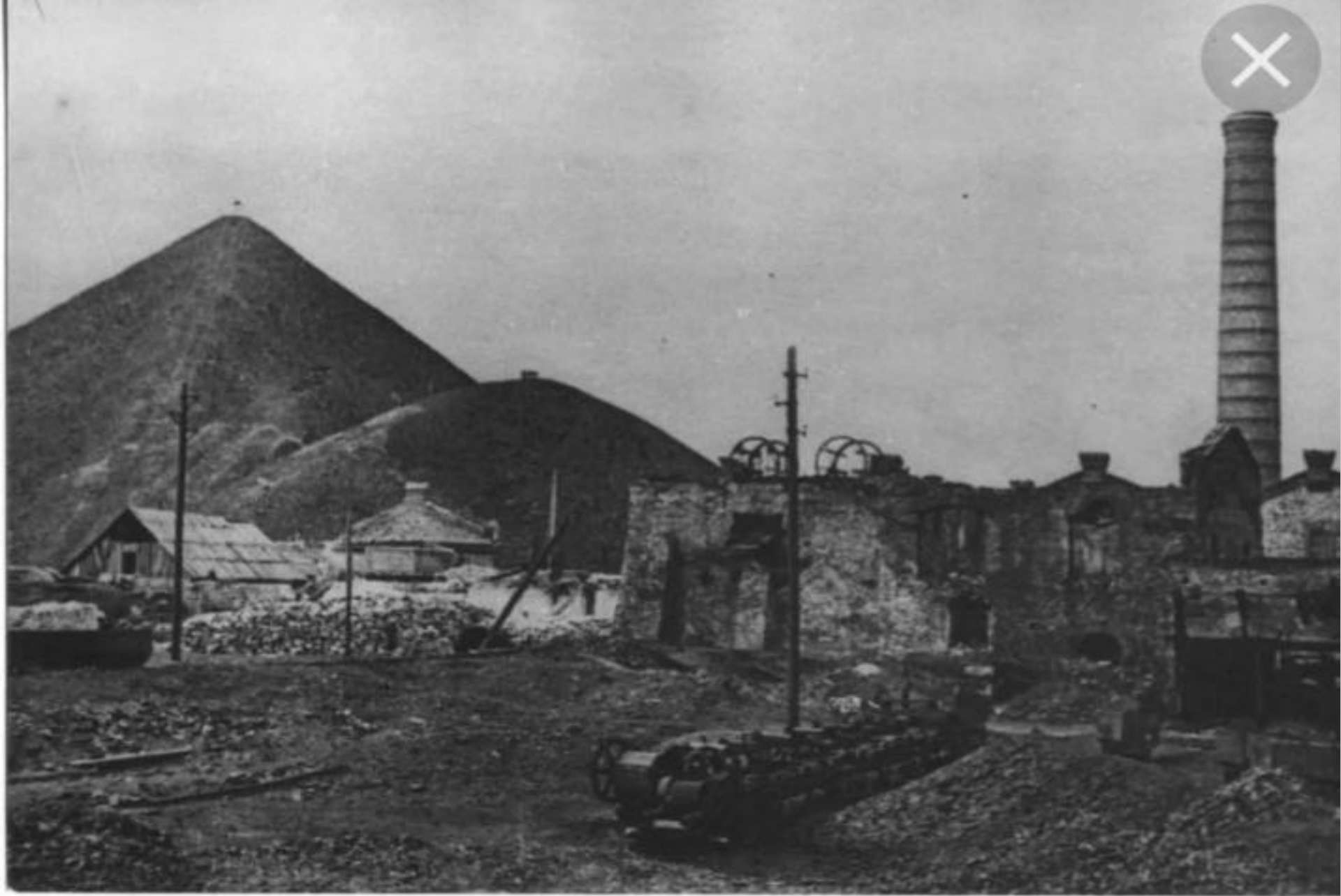
В 1946 году при сборе угля шахта обвалилась, и прабабушка погибла.