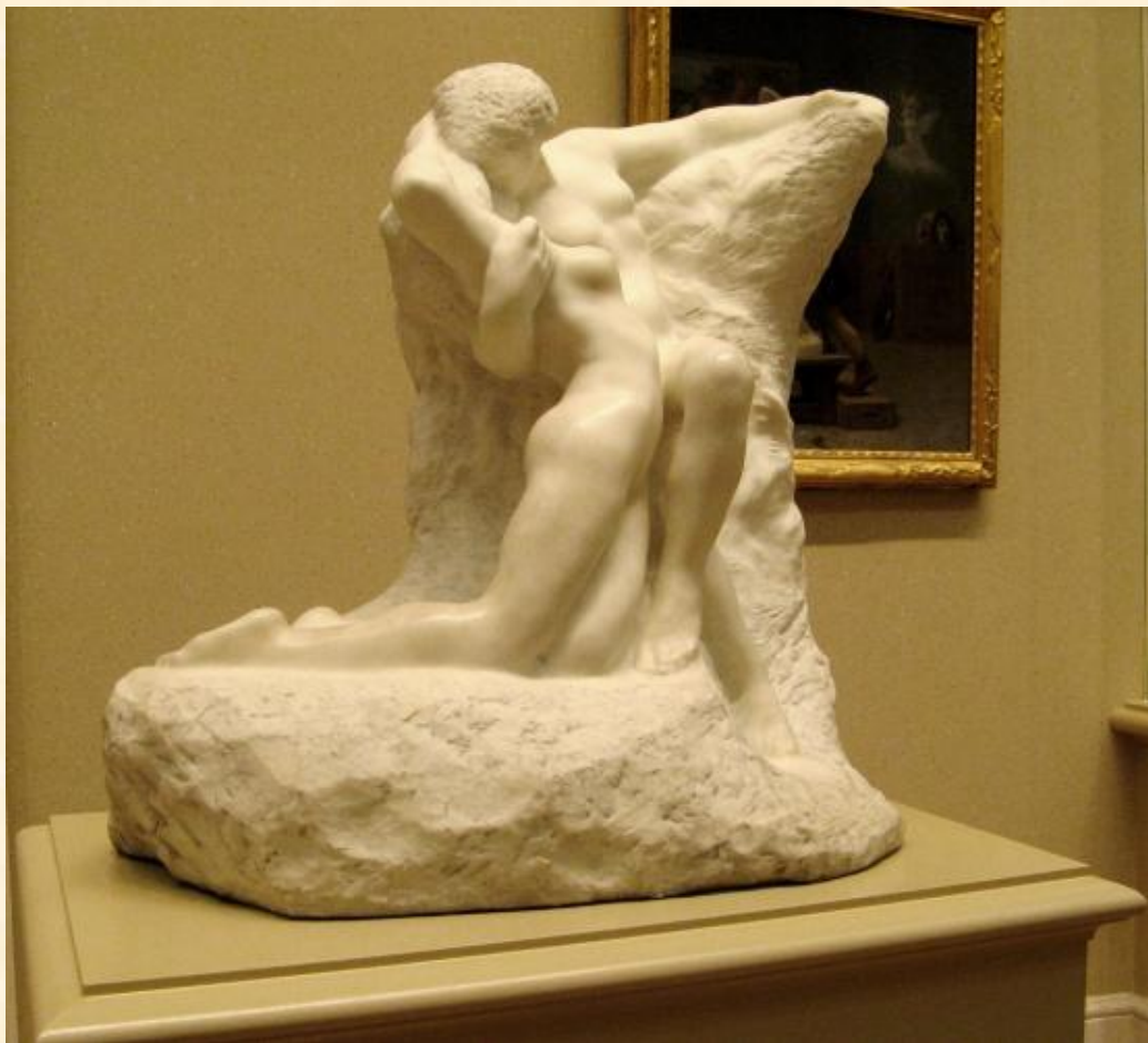
О. Роден вверху Вечная весна, справа Поцелуй, 1882