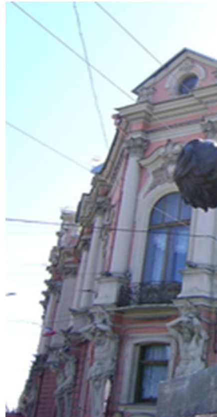
5. Монументально-декоративная скульптура