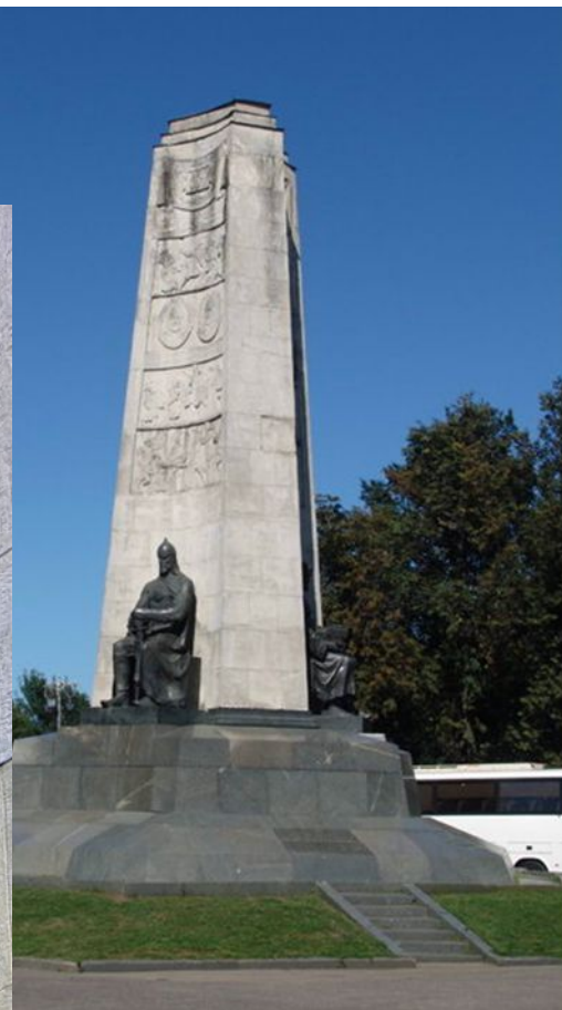
Даниил Рябичев 1969 г.