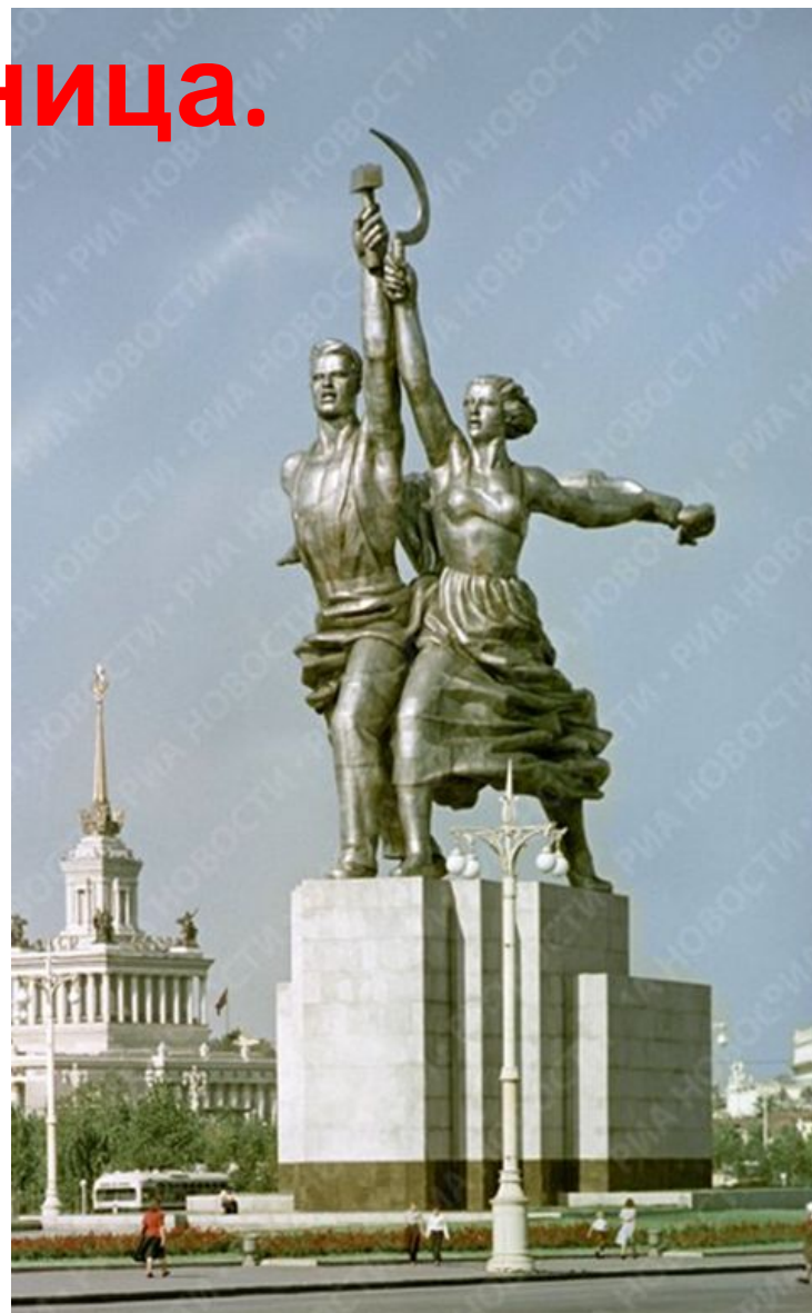
Вера Мухина. 1937 год.

это 25-метровая скульптурная группа из двух фигур, поднявших над головами серп и молот – юноша и девушка, олицетворяющие собой хозяев советской земли — рабочий класс и колхозное крестьянство. В 2003 году монумент был разобран на 40 фрагментов, реконструкция была полностью завершена только в ноябре 2009 года. Постамент, на котором размещена скульптура, на 10 м выше предыдущего. В павильоне-постаменте разместится выставочный зал и музей Веры Мухиной