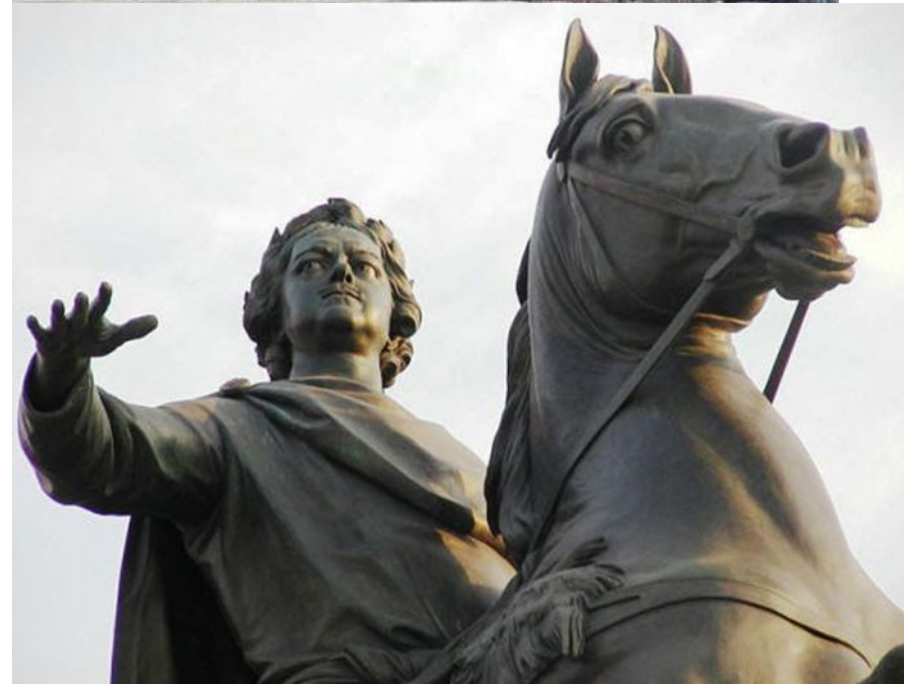
Этьен Фальконе. 1782 год.