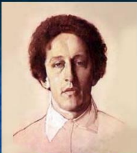
А.Блок. Портрет работы К. А. Сомова. 1907.