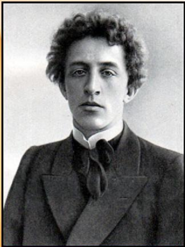
БЛОК АЛЕКСАНДР АЛЕКСАНДРОВИЧ

Тема родины, как известно, главная в творчестве Блока, да и любого подлинного поэта. Здесь мы видим главную связь его с Пушкиным. В переломную эпоху он все чаще обращается к Пушкину. Его статья «О назначении поэта» — это своего рода завещание грядущим поколениям, целиком построенное на пушкинских идеях, на размышлениях самого Блока о Пушкине. Его последнее законченное стихотворение тоже посвящено Пушкину.