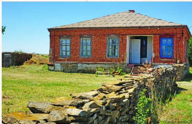
Здание бывшей почтовой станции