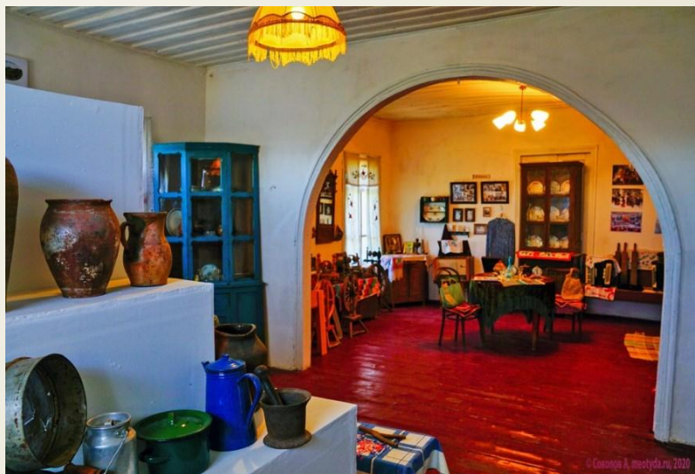
Экспозиции «Горница» и «Стряпная»