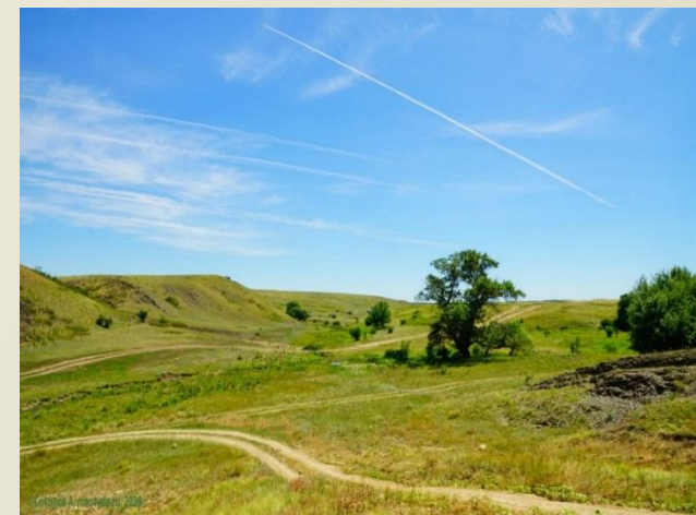
□ Балка Почтовая