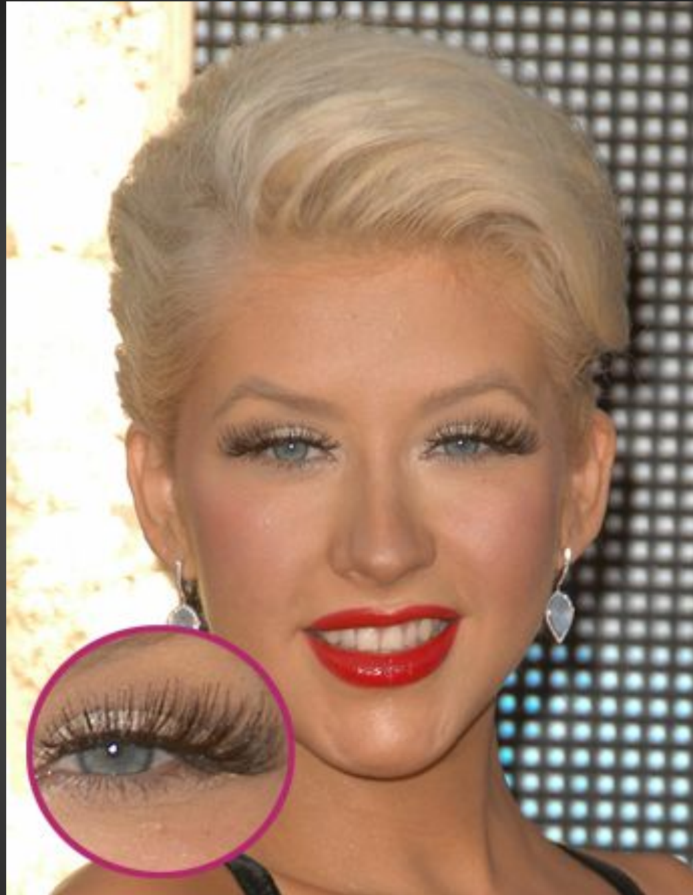
Ошибка: накладные ресницы неподходящего размера или формы