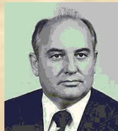
Генсек ЦК КПСС 1985-1991, Президент СССР 1990-1991 М.С.Горбачев