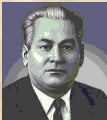
Генсек ЦК КПСС 1984-1985 К.У.Черненко