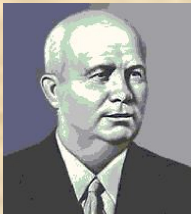
1-й секретарь ЦК КПСС 1953-1964 Н.С.Хрущев