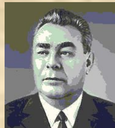
Генсек ЦК КПСС 1964-1982 Л.И.Брежнев