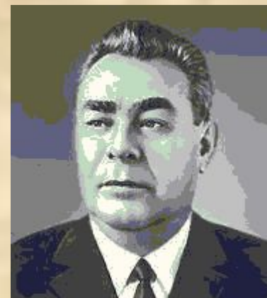
Генсек ЦК КПСС 1964-1982 Л.И.Брежнев