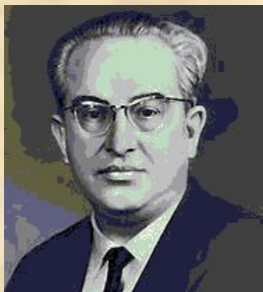
Генсек ЦК КПСС 1982-1984 Ю.В.Андропов