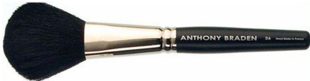
Кисть № 7