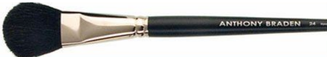
Кисть № 8