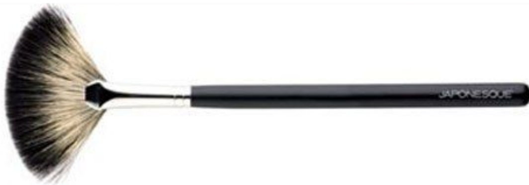
Кисть № 9