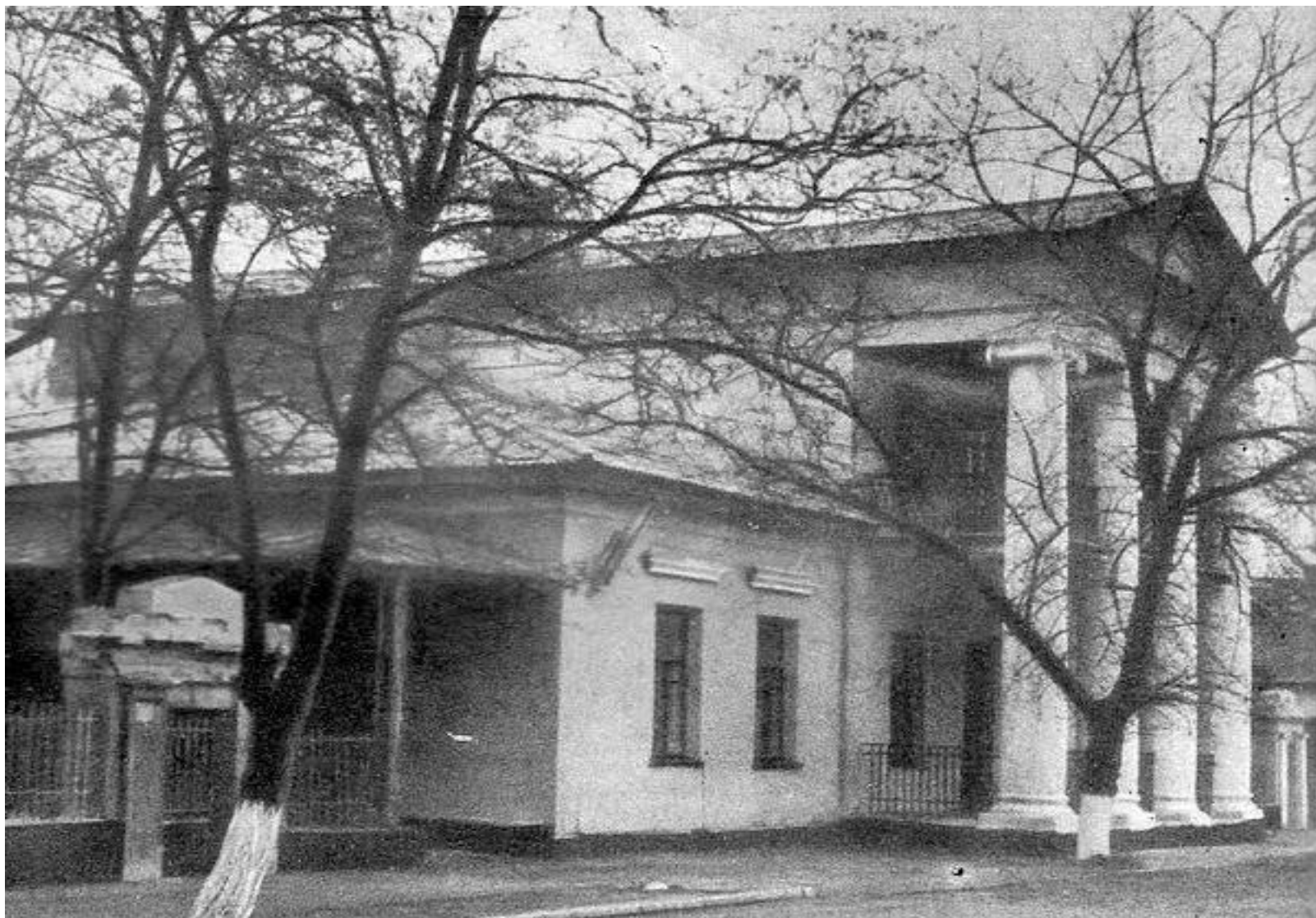
Луганская областная физиотерапевтическая поликлиника имени профессора А. Е. Щербака (в простонародье «водолечебница»)