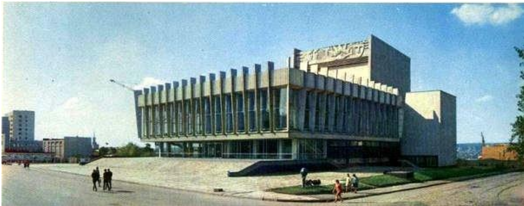
Луганский (Ворошиловградский) академический русский драматический театр имени П. Луспекаева