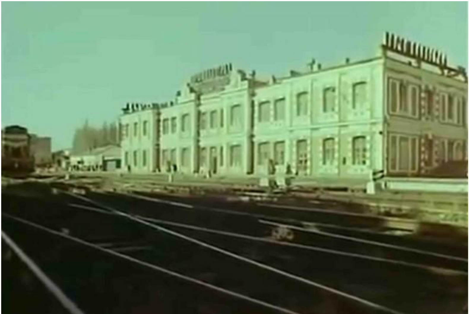
Старое здание Железнодорожного вокзала