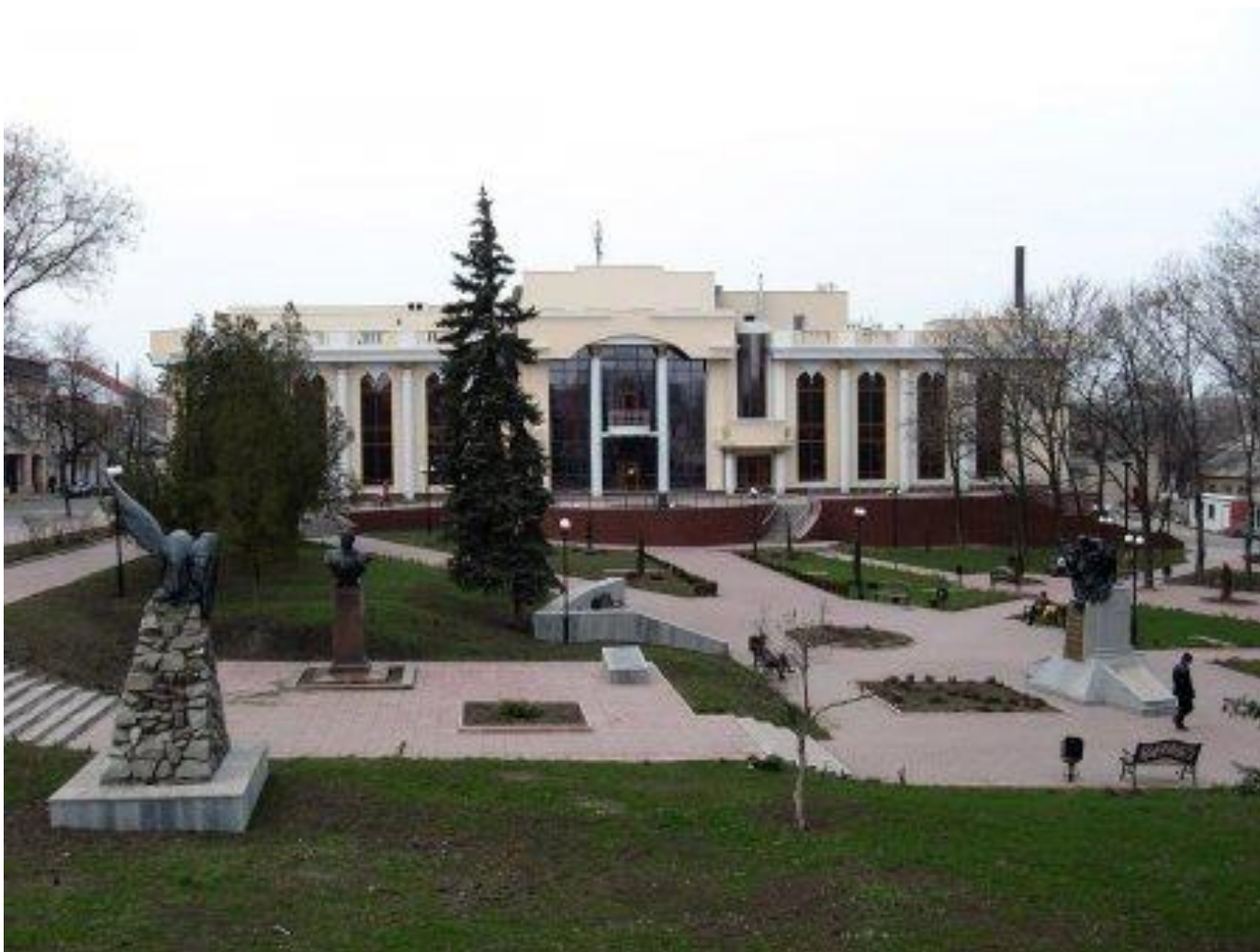
Здание Луганской академической филармонии, после реставрации