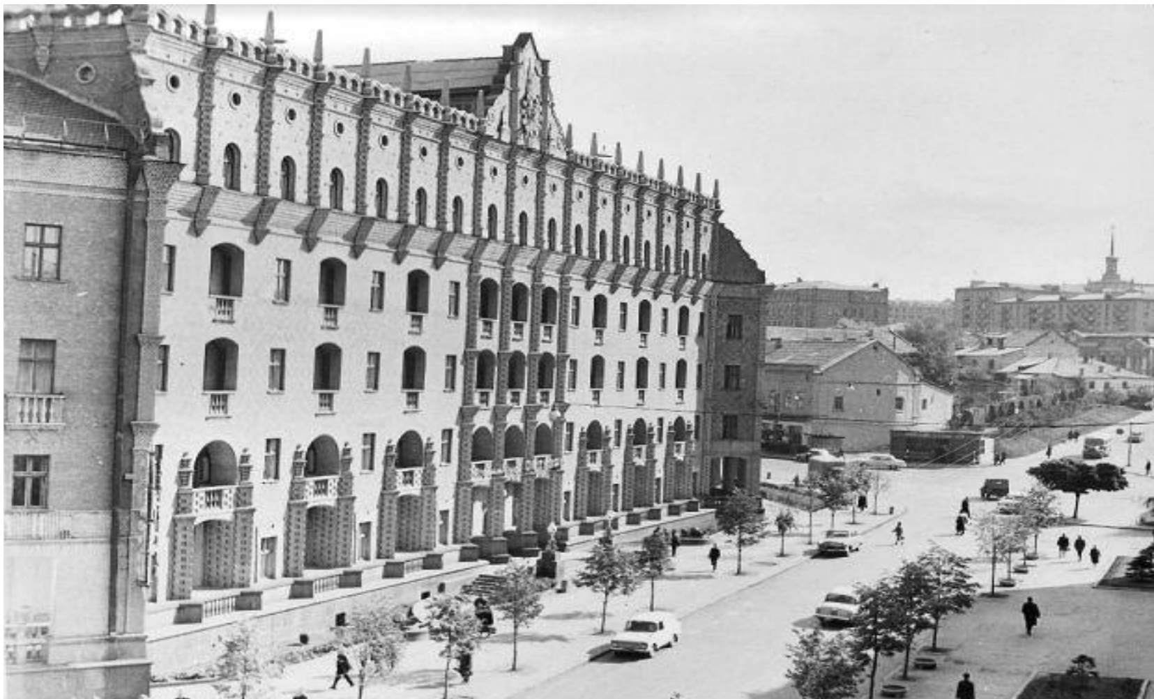
Гостиница «Октябрь» (Гостиница «Украина»)