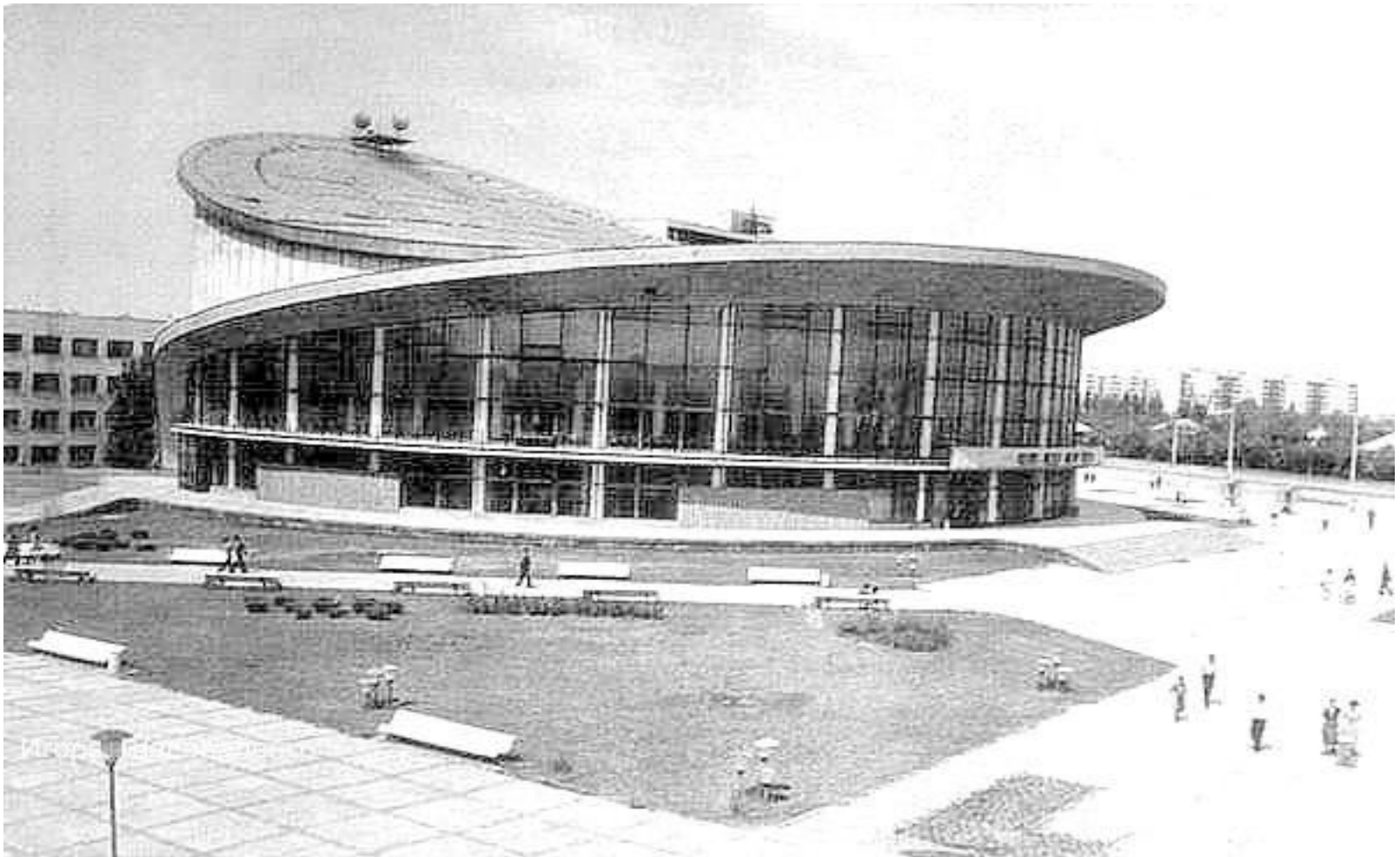
Луганский (Ворошиловградский) государственный цирк