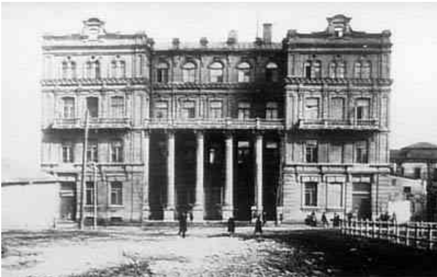
Дом Васнёва, бывший ДИНО (Донецкий институт народного образования), а также бывшая 7-я городская поликлиника при заводе им. Ленина