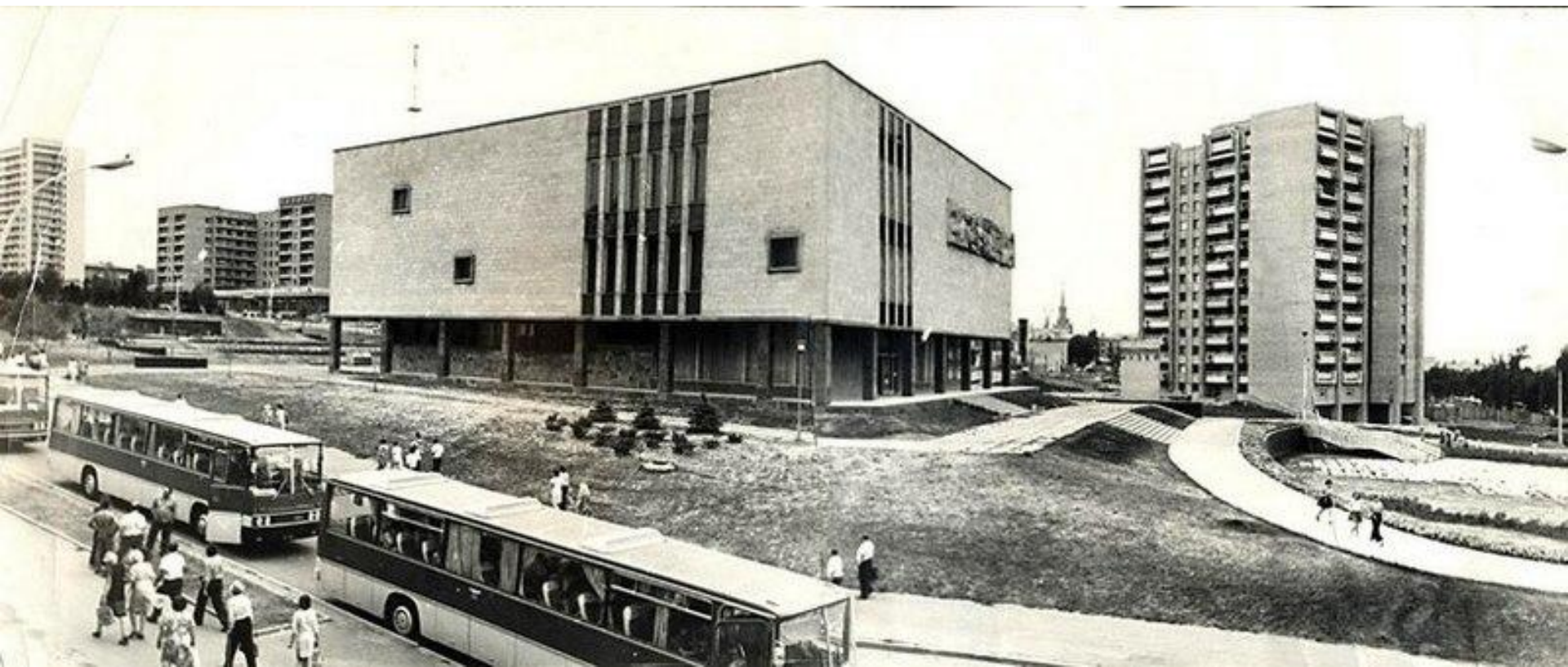
Луганский областной краеведческий музей