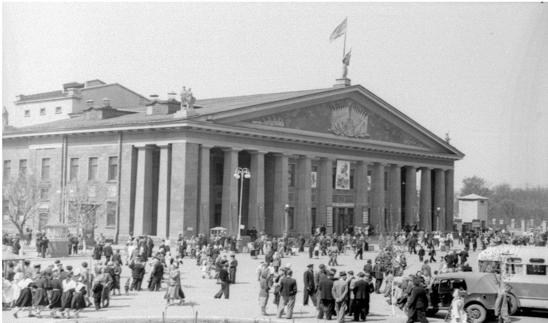
Луганский областной дворец культуры железнодорожников