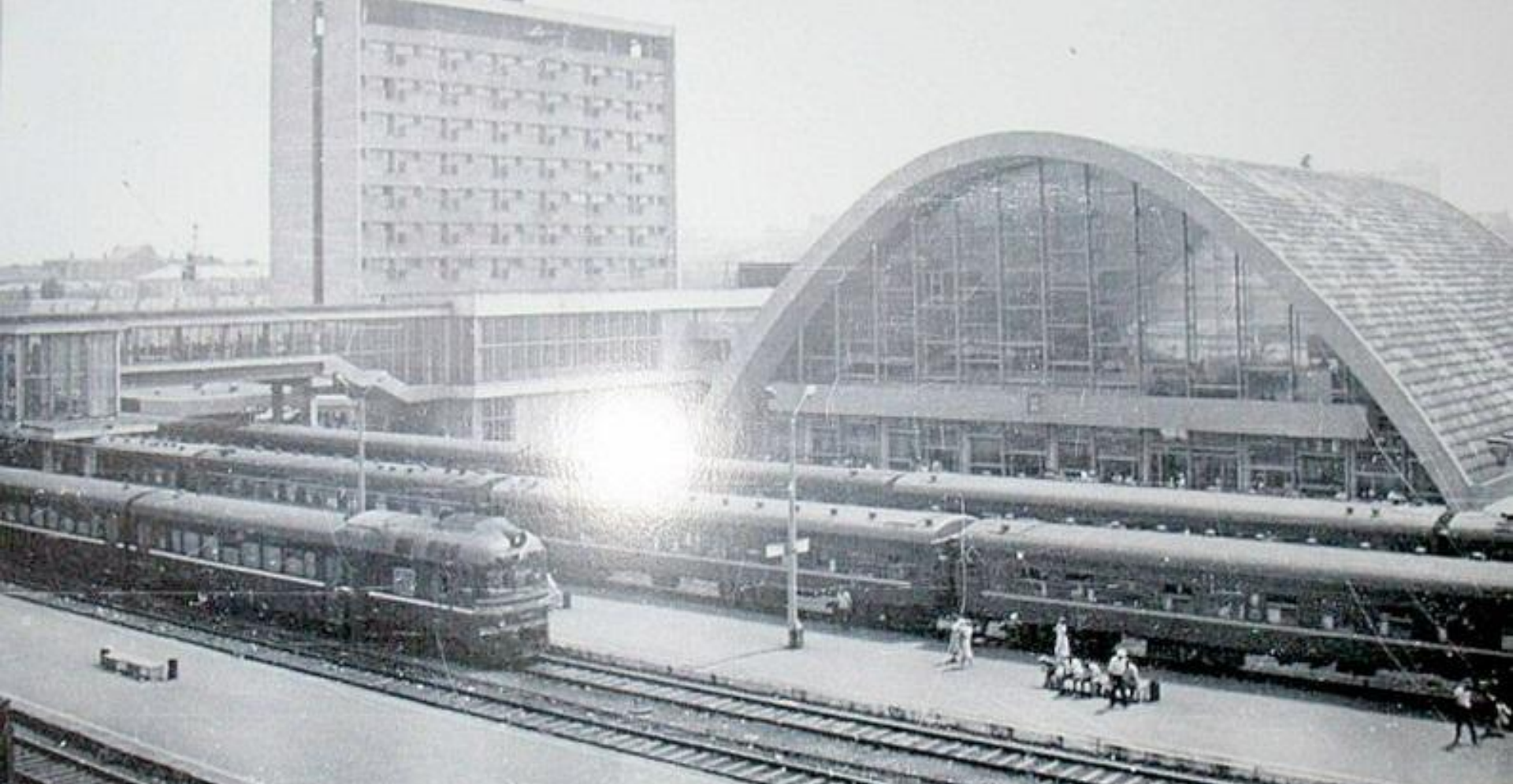
Новая железнодорожная станция города Ворошиловграда (Луганска)