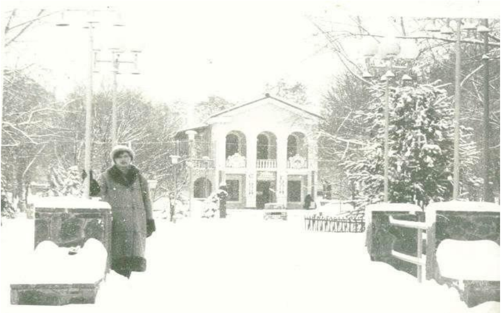
Усадьба Н. Холодилина (так же известное как «Зал игровых автоматов» или «Здание в парке 1-го мая»)