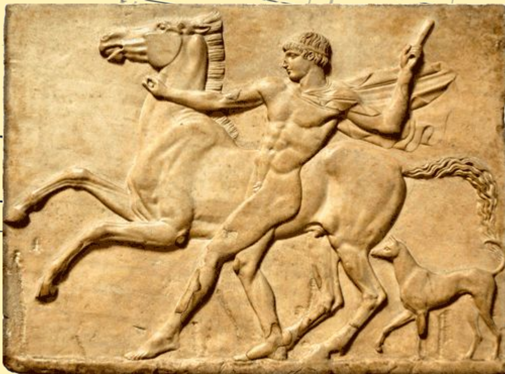
Юноша с конём (барельеф)