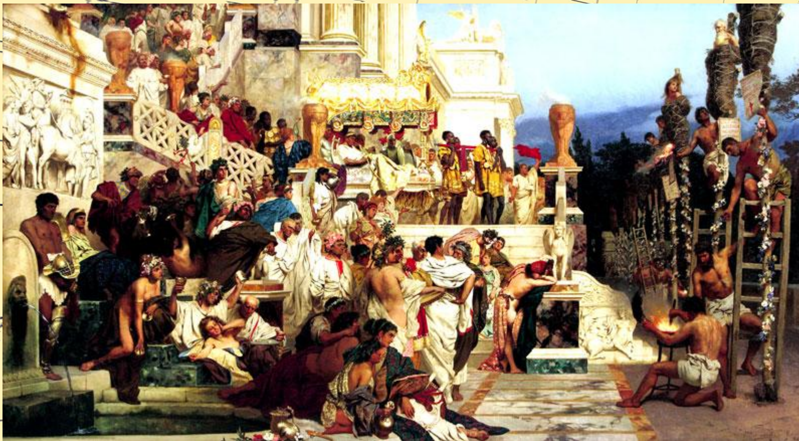
Генрих Семирадский. Светочи христианства (Факелы Нерона). (1882 год).