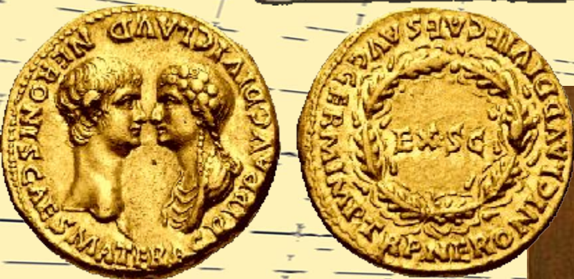
Золотая монета с изображением Нерона и Агриппины