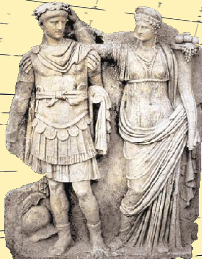
Нерон и Агриппина