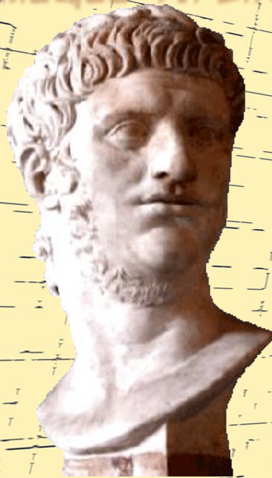
Нерон (54-68 гг.)