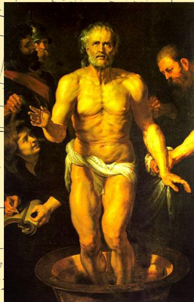
Рубенс. Смерть Сенеки.