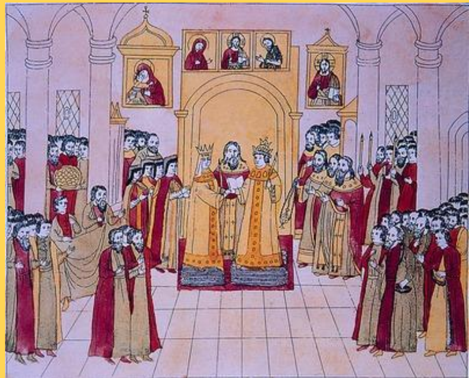
Венчание Михаила Фёдоровича и Екатерины Стрешнёвой