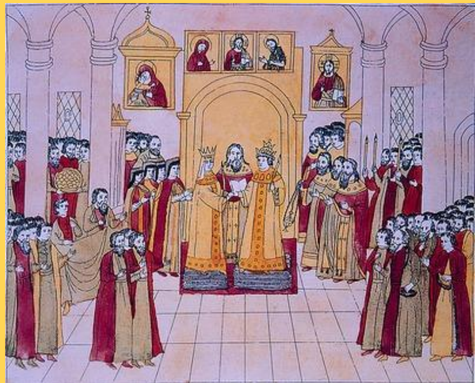
Венчание Михаила Фёдоровича и Екатерины Стрешнёвой