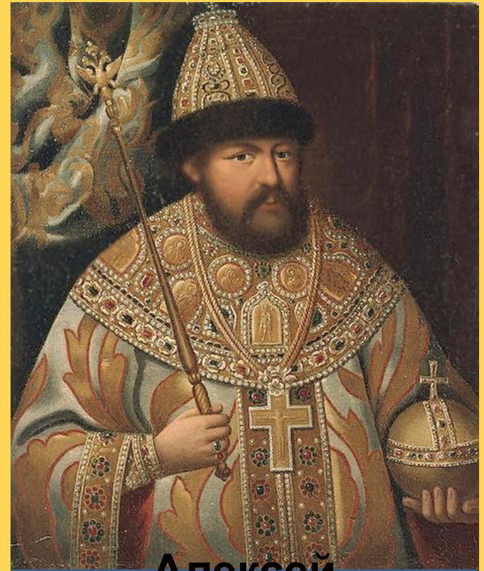
Алексей Михайлович «Тишайший»