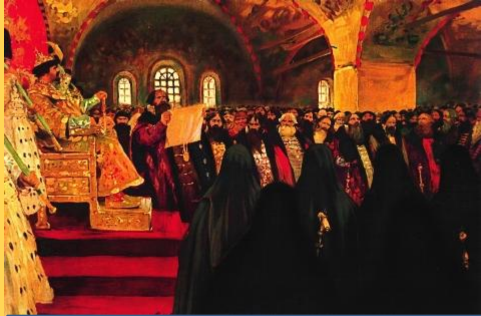
С. Иванов Земский собор

✓ Функции выполнял с соизволения и по указанию верховной власти