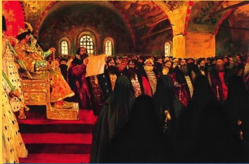
С. Иванов Земский собор

✓ Функции выполнял с соизволения и по указанию верховной власти