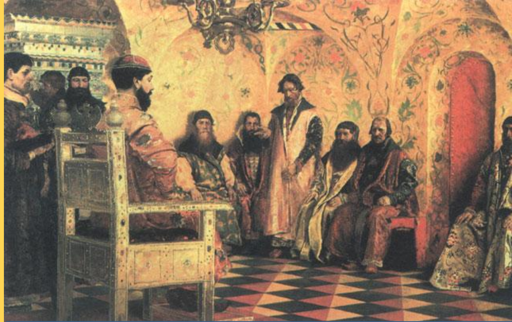
Царь Михаил Фёдорович и бояре