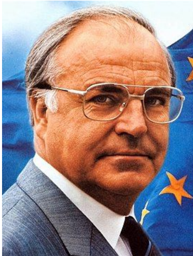
Гельмут Коль – канцлер ФРГ (1982-1998 гг.)