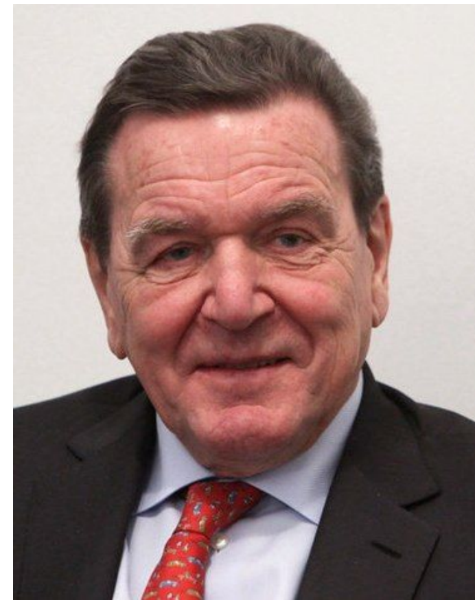
Герхард Шрёдер – канцлер ФРГ (1998-2005 гг.)