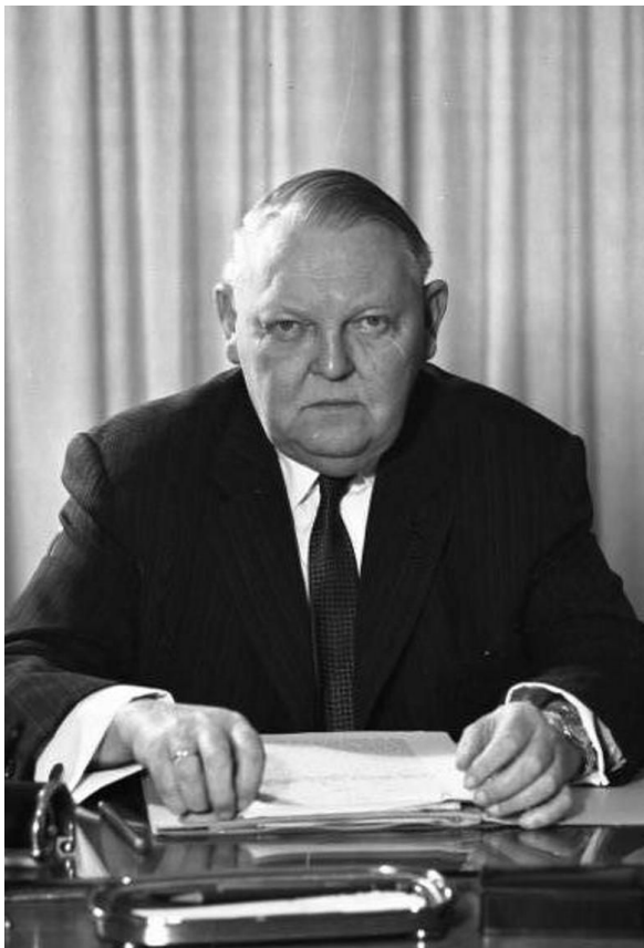
Людвиг Эрхард – канцлер ФРГ (1963-1966гг.)