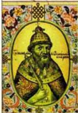
Царь Иван Грозный