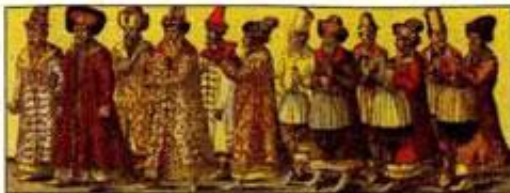
Русское посольство к германскому императору