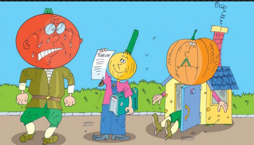
1) Признание права

2) реституция — восстановление положения, существовавшего до нарушения права, — известный со времён римского права возврат субъектов правоотношений в первоначальное положение ( restitutio in integrum ) и пресечение действий, нарушающих право или создающих угрозу его нарушения (чаще всего состоит в запрете осуществления определённой деятельности);