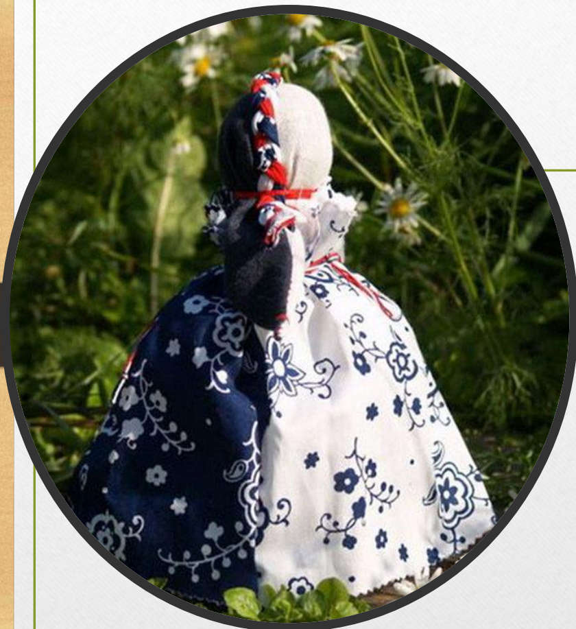
День - Ночь

День Ночь , как и Неразлучников, тяжело спутать с другими. Это двухсторонний оберег. Сделать его можно несколькими способами: взять две отдельные фигурки и скрепить друг с другом спиной к спине. Или же сделать одну фигурку с двумя лицевыми сторонами.