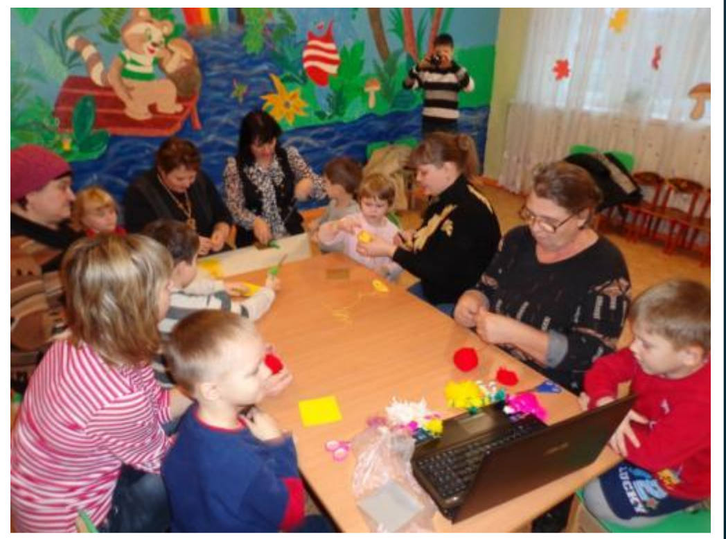
Групповые сеансы для детей (совместно с родителями) с педагогом-психологом