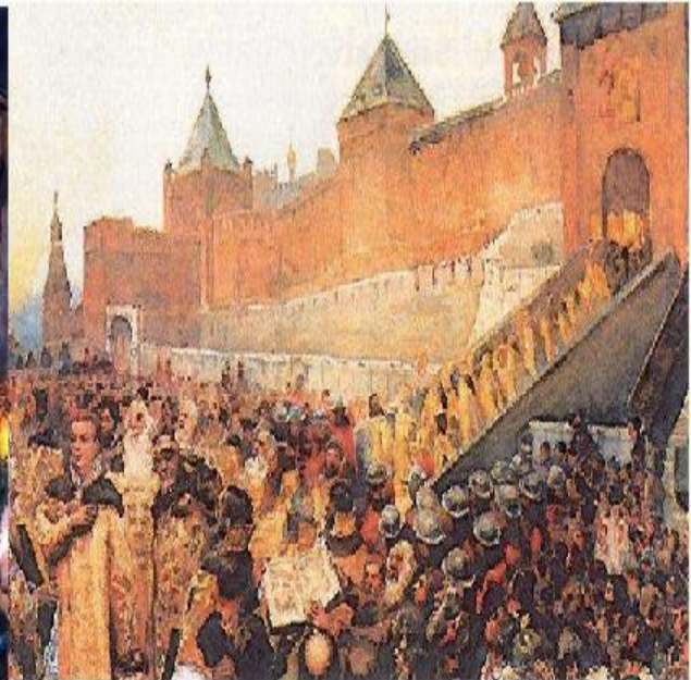
Въезд Лжедмитрия I в Москву