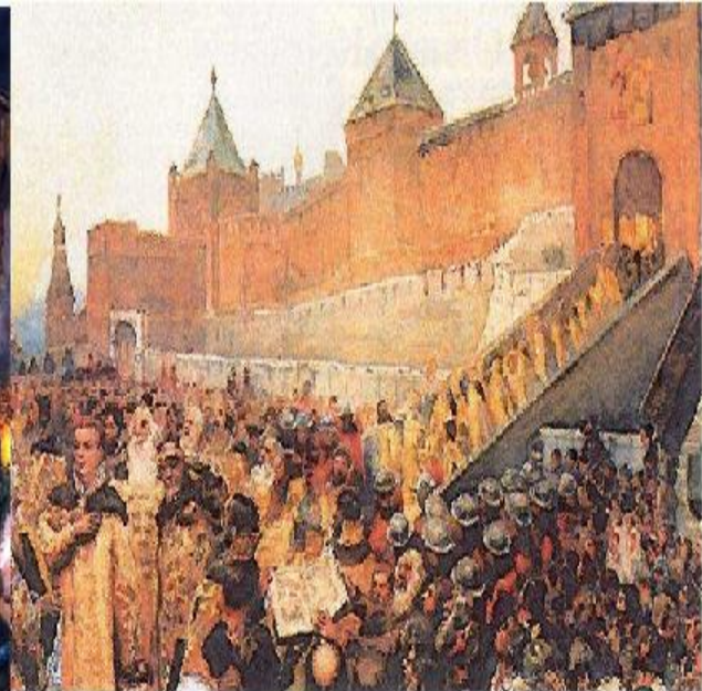
Въезд Лжедмитрия I в Москву