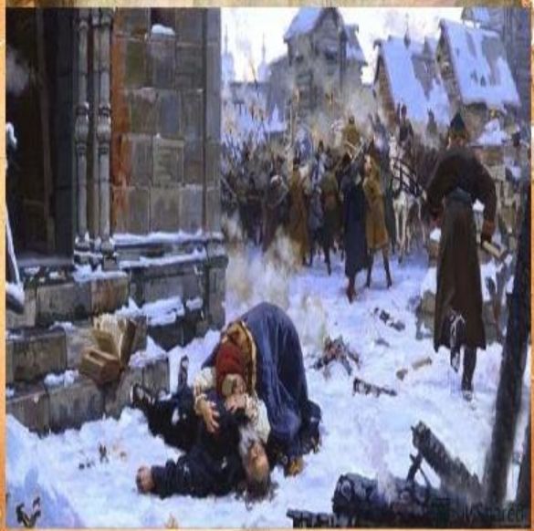
«Смутное время» 1598 – 1613 гг.