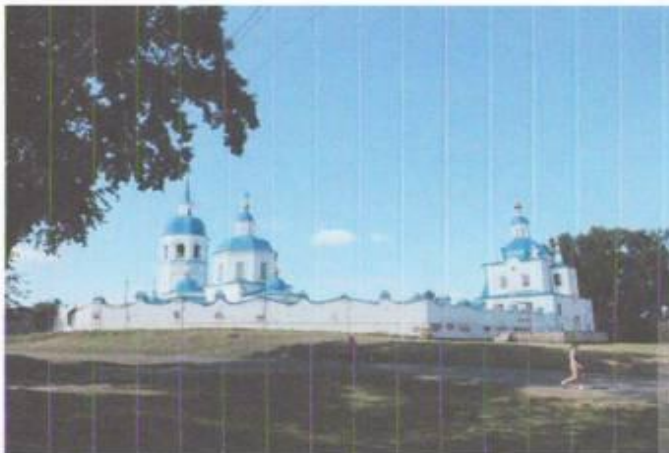
Енисейск Спасо-Преображенский мужской монастырь