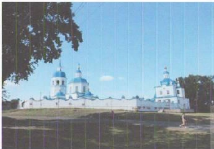
Енисейск Спасо-Преображенский мужской монастырь