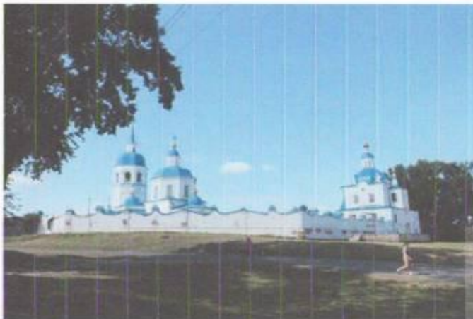
Енисейск Спасо-Преображенский мужской монастырь