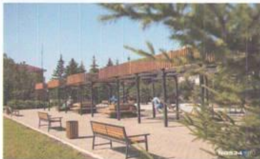
Енисейск Парк качелей