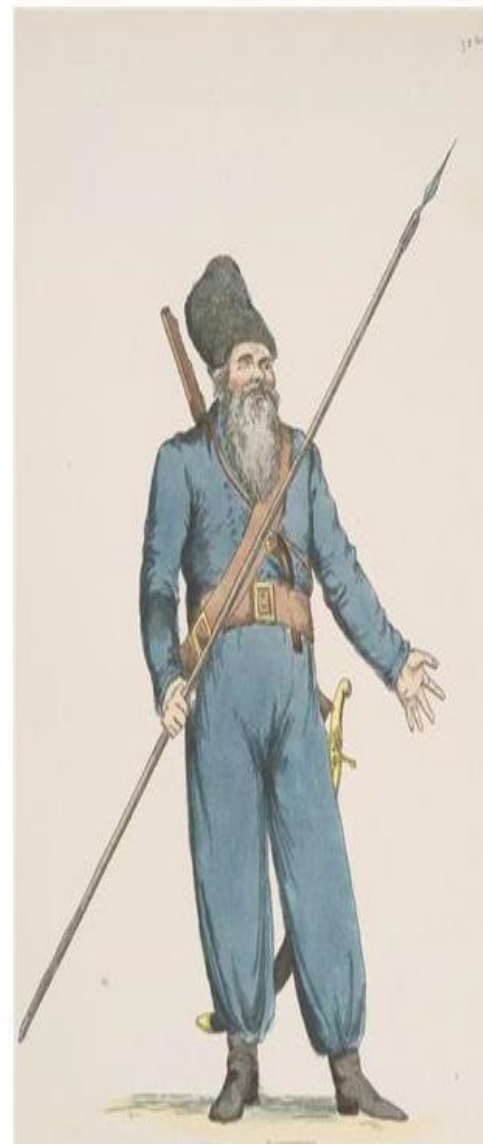
1-копья, 2-рогатины 3-совня

Пикой можно было свободно фехтовать как одной рукой, так и двумя, особенно в конном бою при управлении конем ногами. Можно отметить, что казаки использовали пики или дротики (укороченный вариант пики) в пешем строе, при штурме крепостей и в рукопашных атаках.