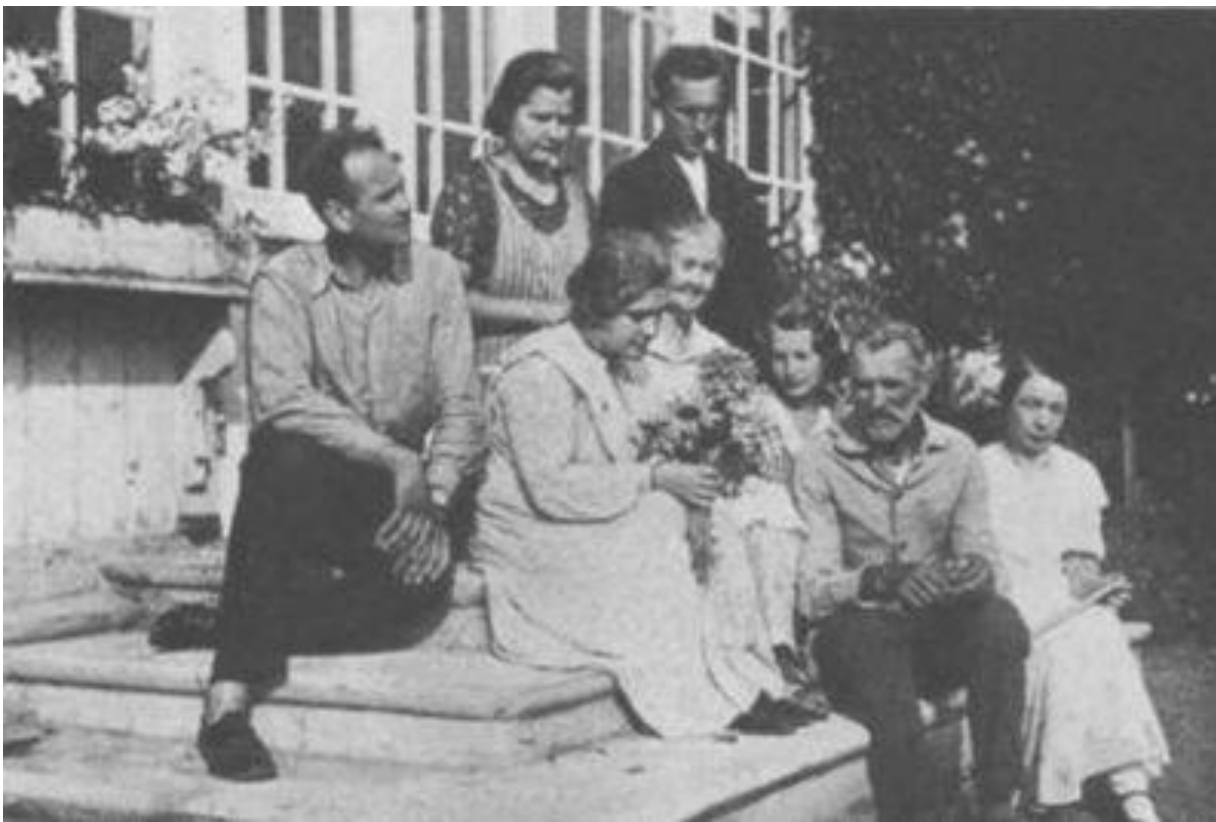
Pēc lekcijas Latvijas Tautas universitātē Mūrmuižā