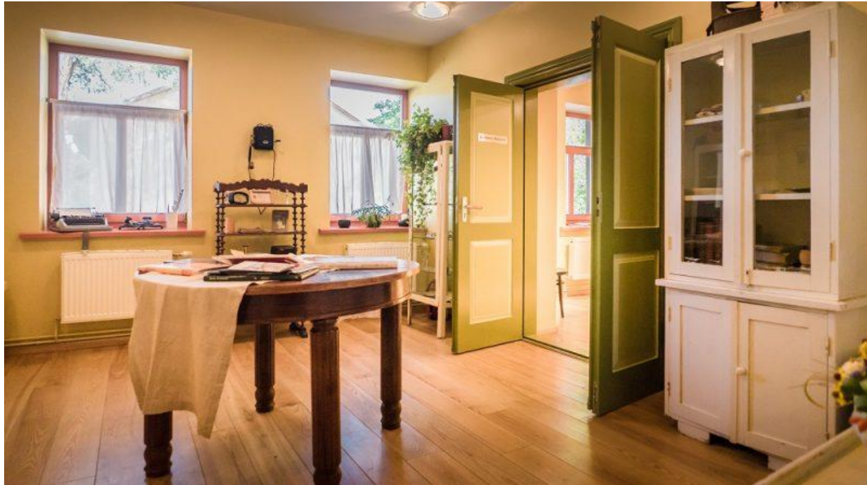
Zentas Mauriņas piemiņu istaba