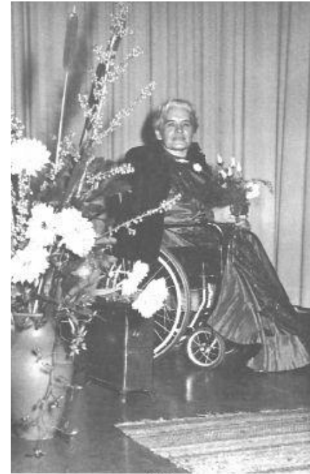
Lübeck Vortrag am 27. September 1954