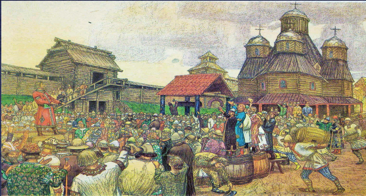
Новгородское вече А. М. Васнецов

Согласованное решение вече оформлялось «вечной грамотой» и скреплялось печатью