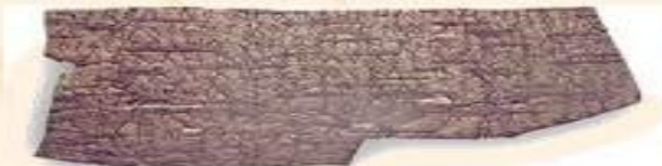
Берестяная грамота. XI век. Письмо сборщика государственных расходов.