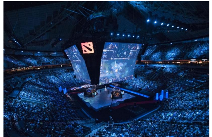
International Star League (die USA)