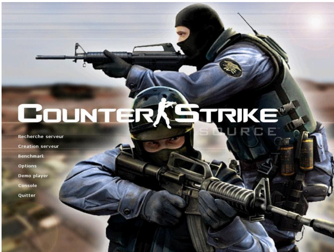
Counter Strike (2001)