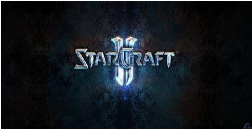
Star Craft 2