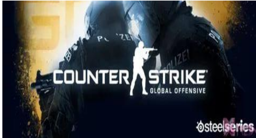
Counter Strike: Global Offensive