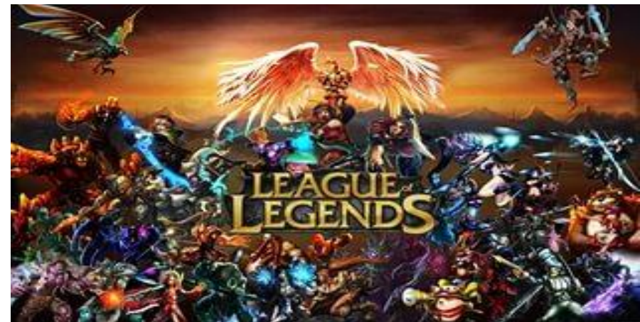
Leagues of Legends