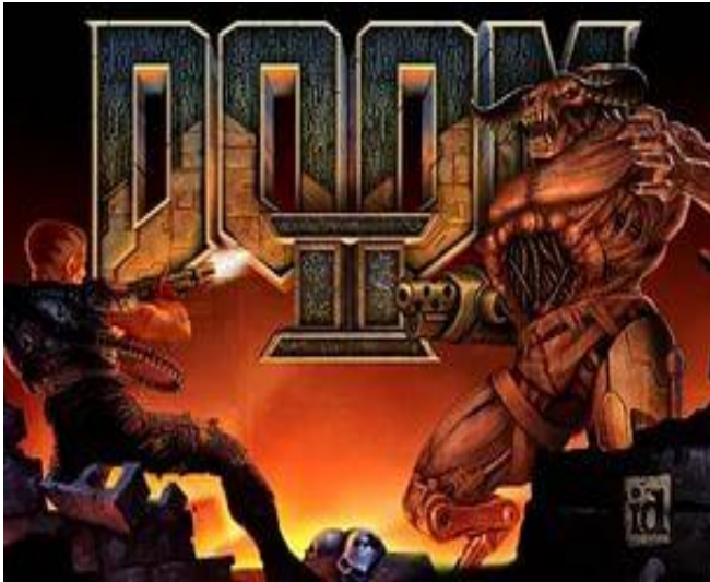
Doom 2 (1994)