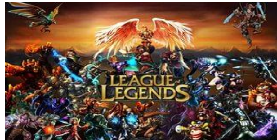
Leagues of Legends