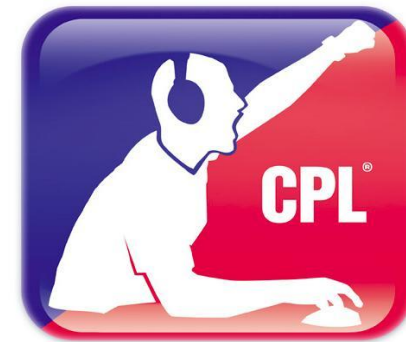
Cyberathlete Professional League