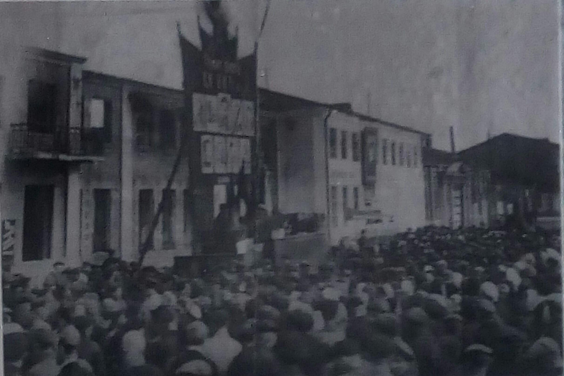
9 Мая 1945г. Митинг рабочих и учащихся ЖУ № 1 в честь Победы.