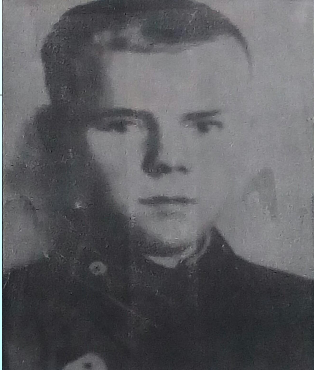
Латышев В. Ф – Герой СССР , Выпускник ФЗУ 1942г.