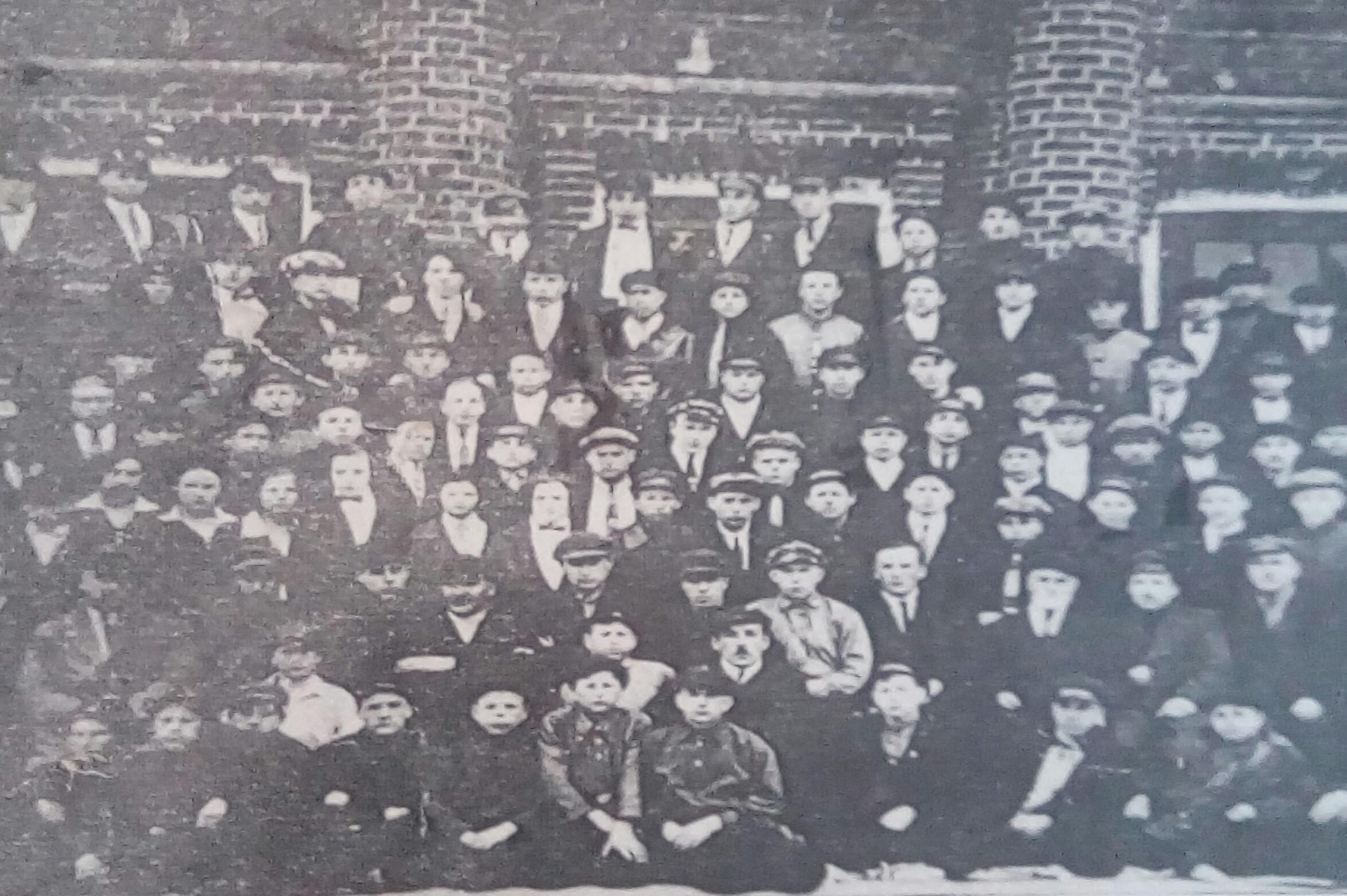
1927г. Школа ученичества Сызранско – Вяземской железной дороги. 5 – летний юбилей.