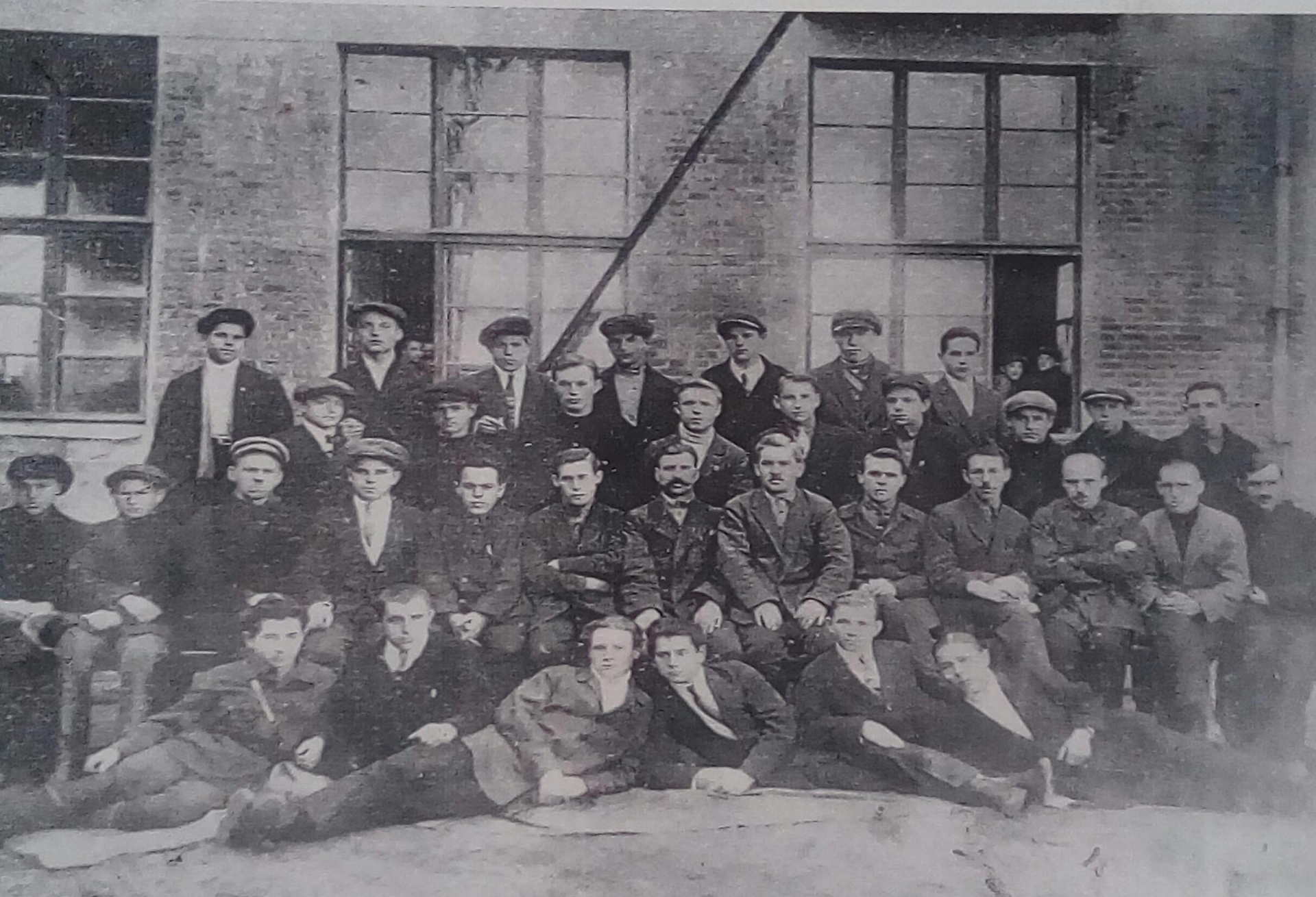
Выпуск учащихся ФЗУ 1925 г.