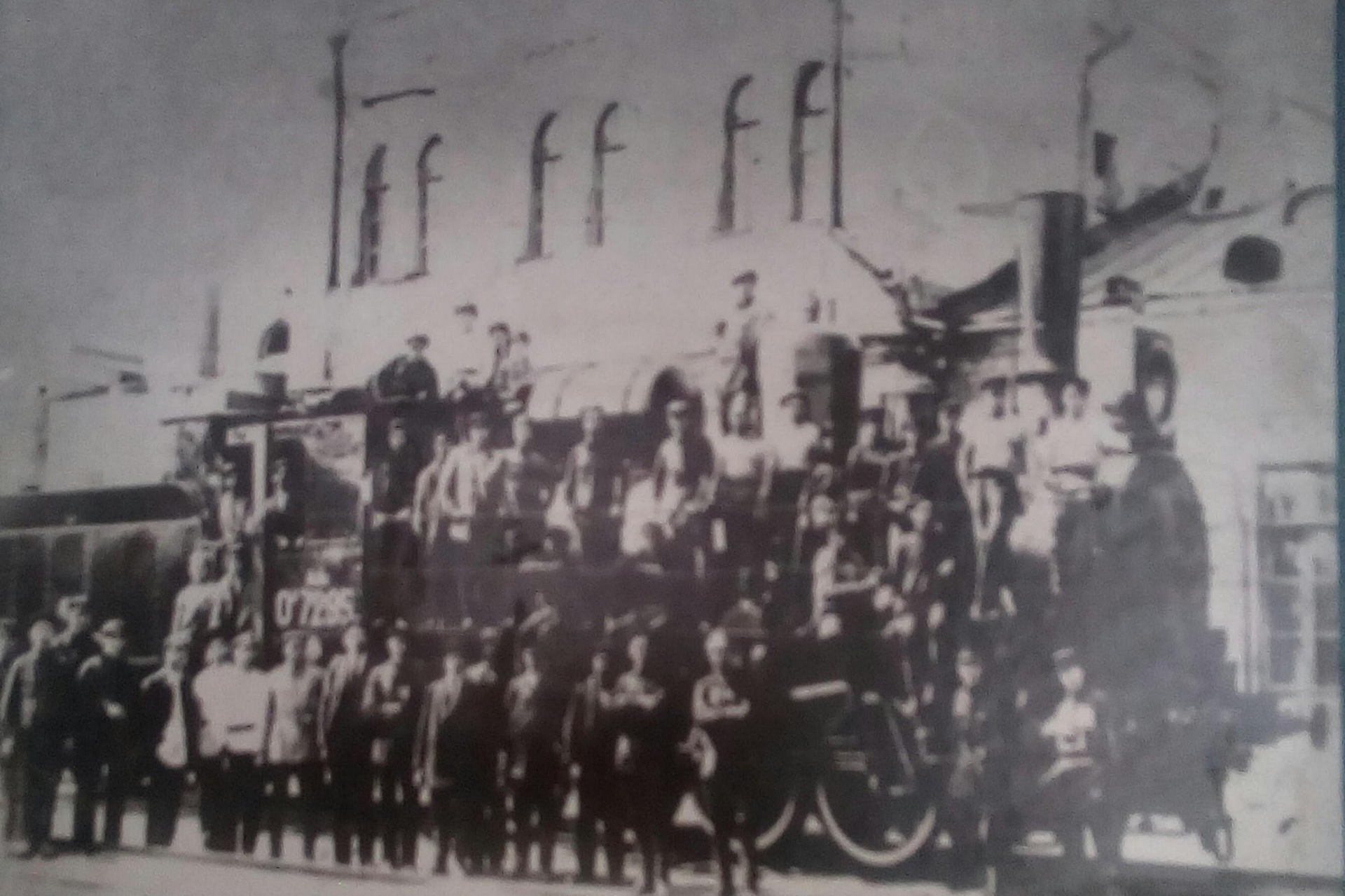
Первый паровоз , выпущенный из ремонта Главных Калужских мастерских при участии учащихся ФЗУ.