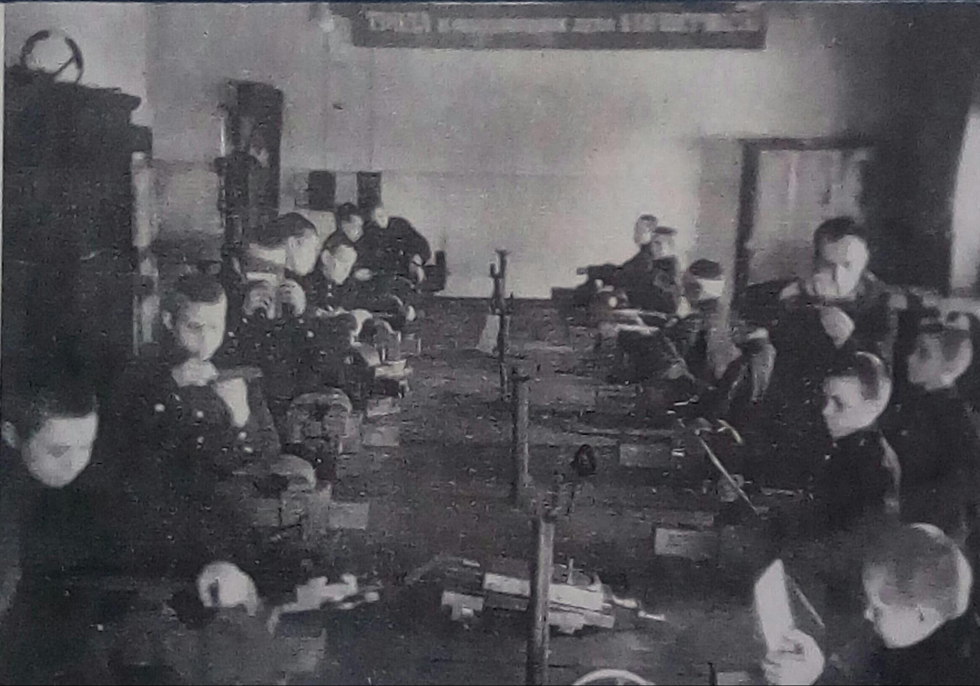
Ученики ФЗУ. 1922г.