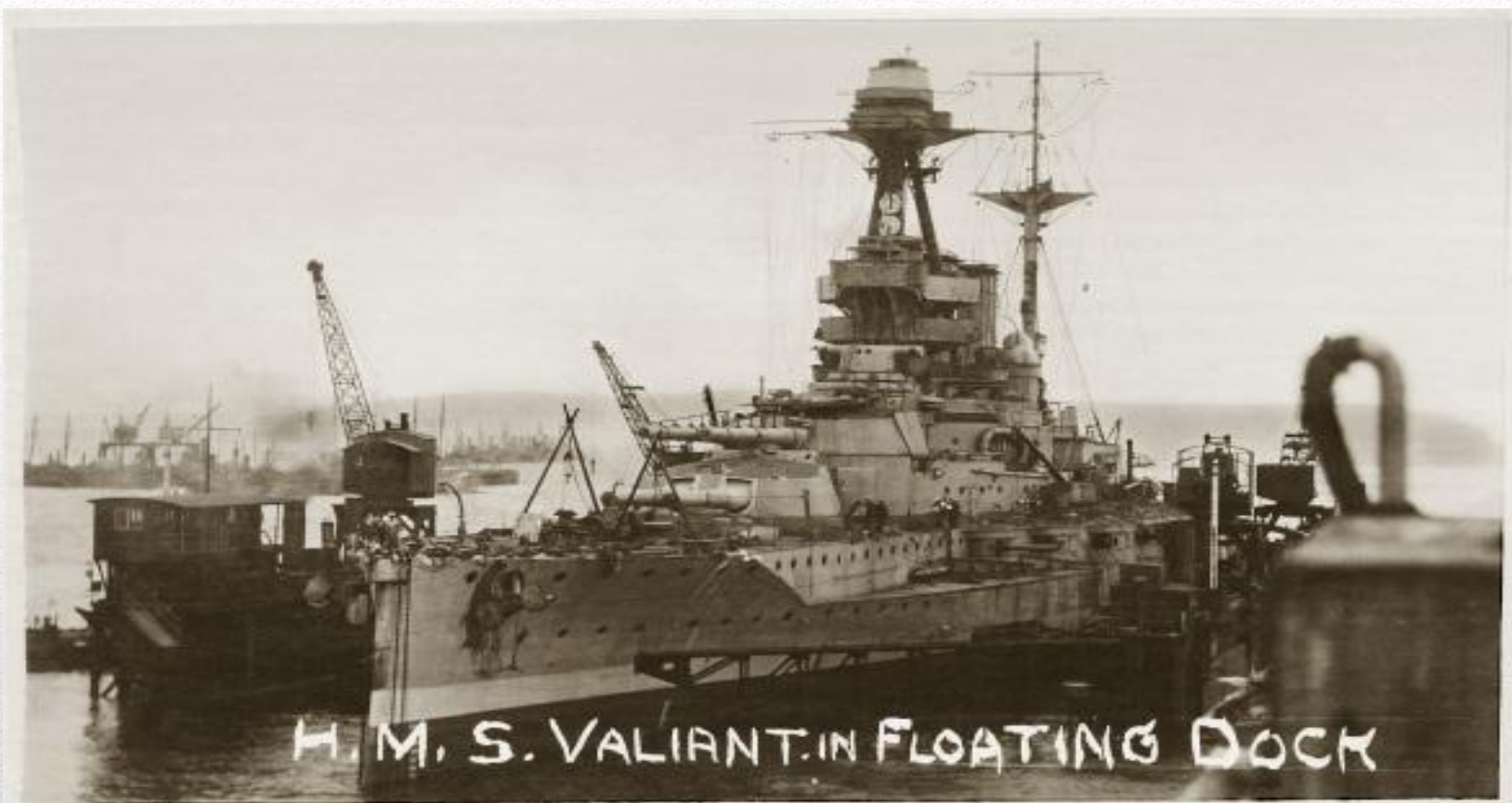
HMS Valiant в доке 1918-1919 год.