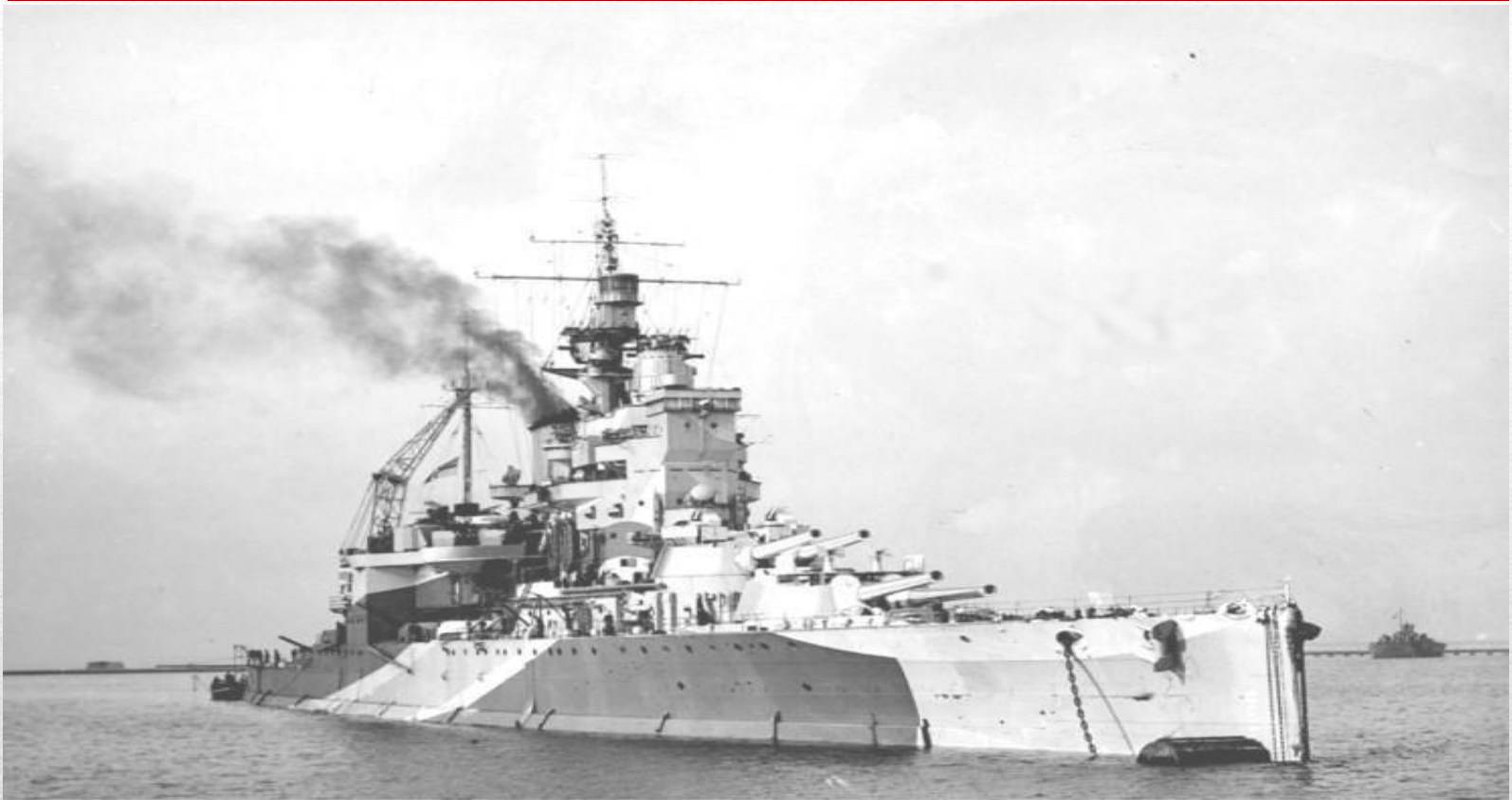
HMS Valiant