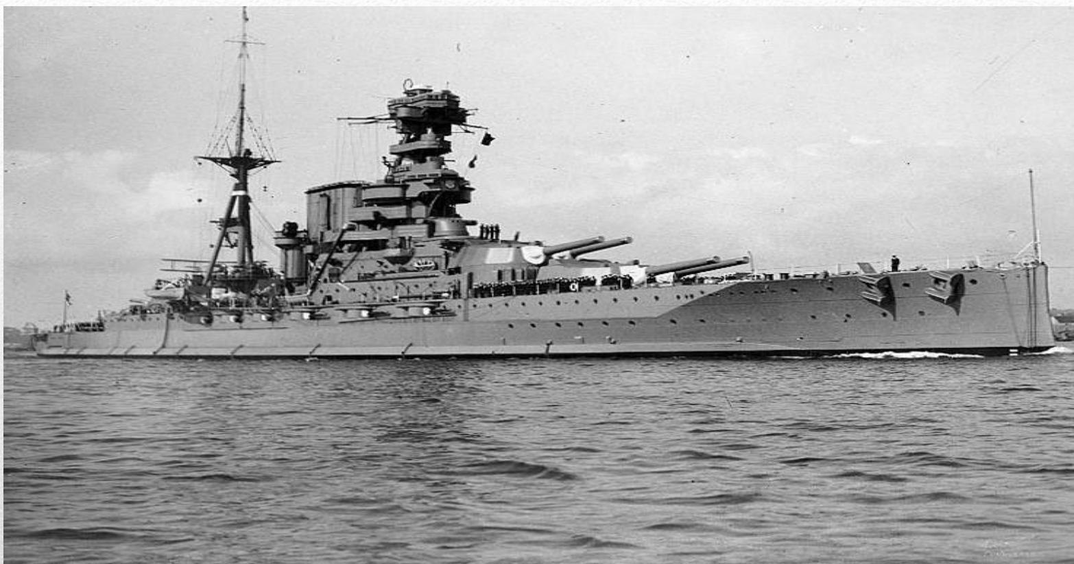
«Varham». Фотография середины 1930-х годов