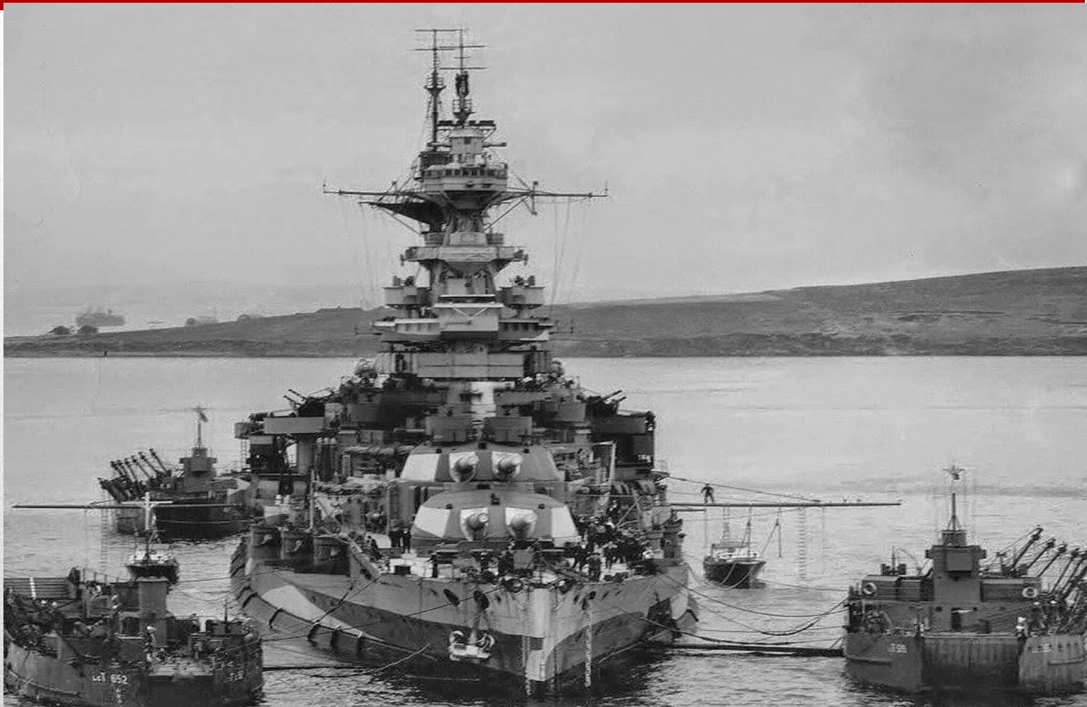
HMS Malaya в базе Скапа-Флоу, 1943 ГОД