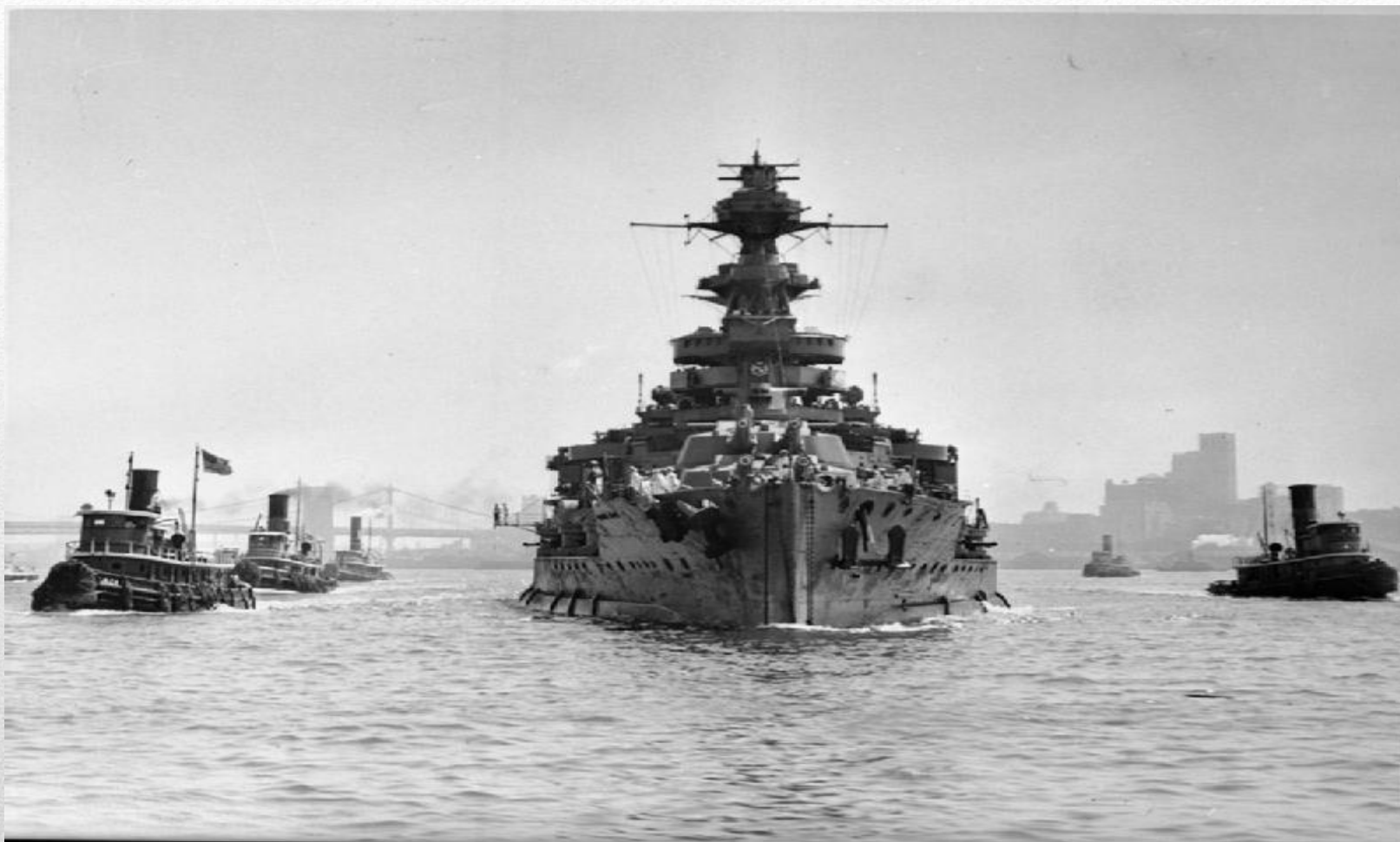
HMS Malaya покидает New York после ремонта, 9 Июля 1941