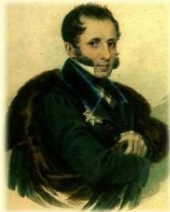
Сергей Семенович Уваров