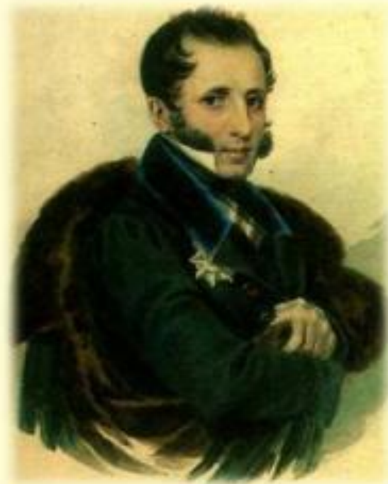
Сергей Семенович Уваров