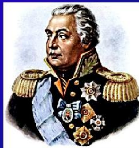
Генерал-фельдмаршал М. И. Кутузов, полный кавалер Ордена Св. Георгия.