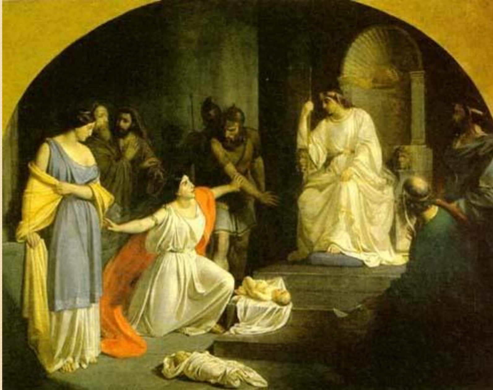
Николай Ге Суд царя Соломона. 1854