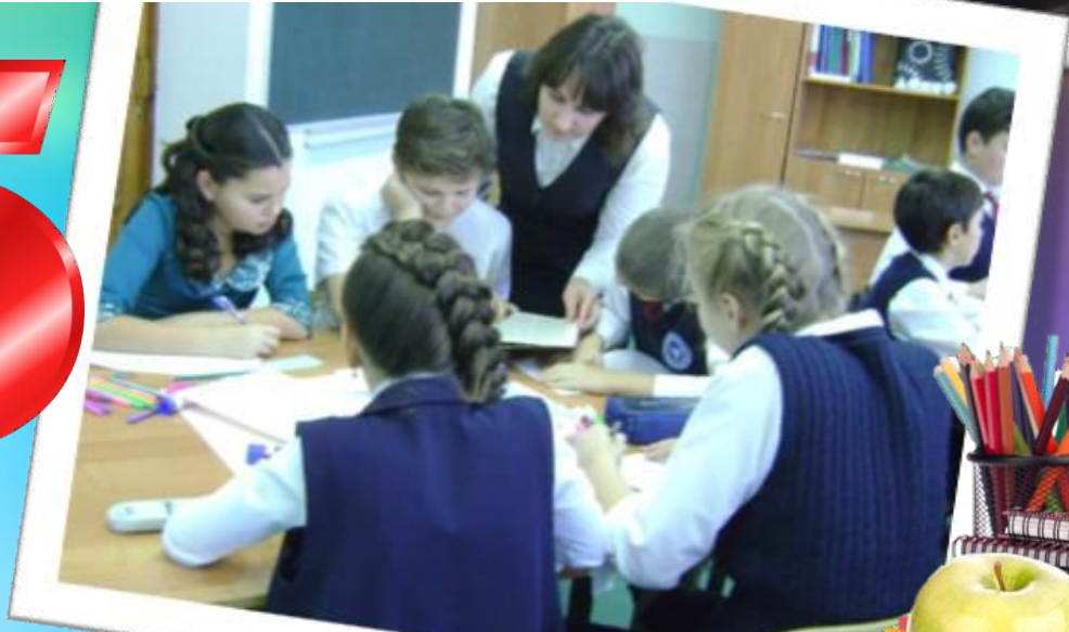
Знание – страшная сила!