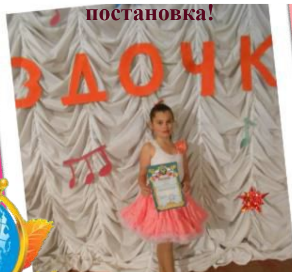
Победитель конкурса «Митрофановские еззвездочки!»