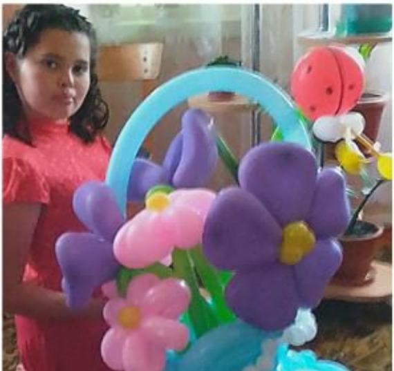
Мои руки не для скуки!