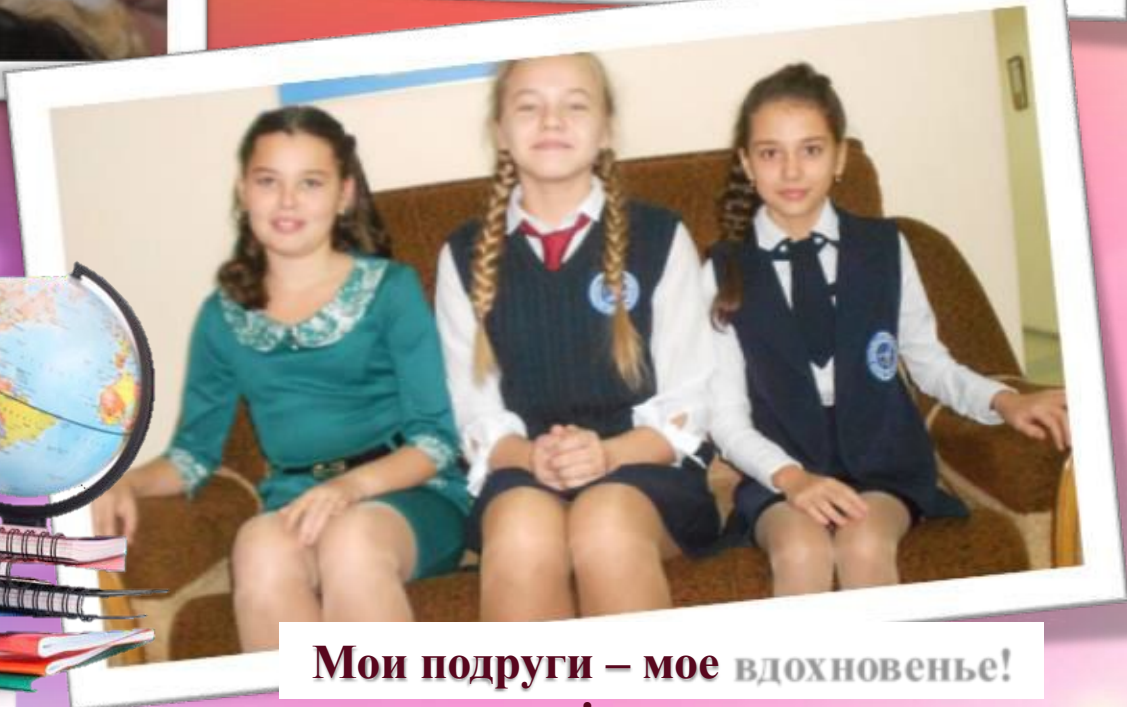
Мои подруги – мое вдохновенье! вдохновенье!