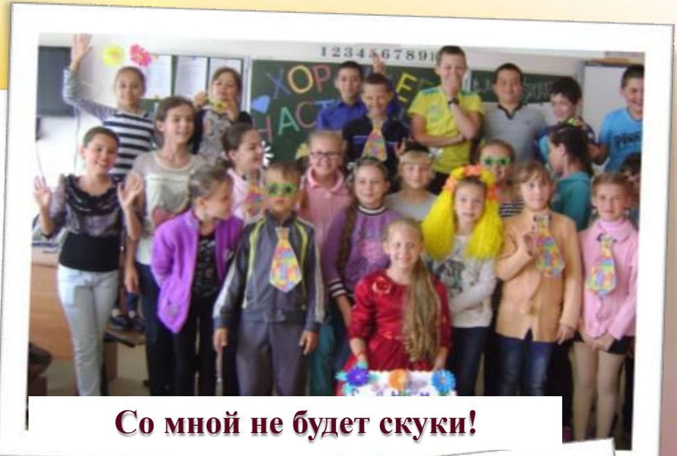
Со мной не будет скуки!