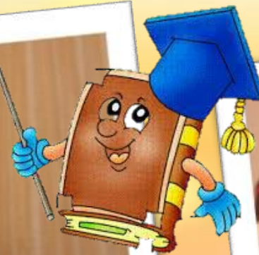
Литературная постановка! постановка!