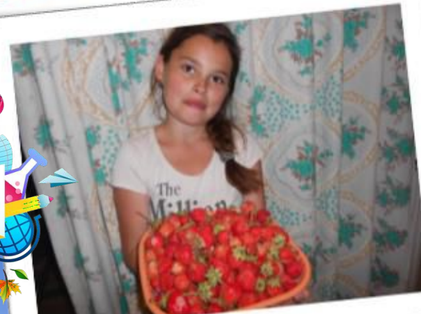
В каждой ягодке мои тайны! тайны!