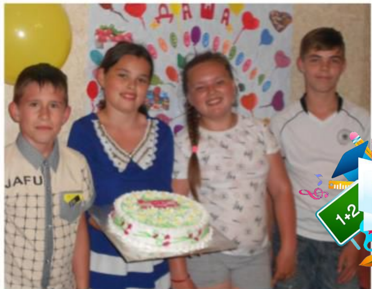
Всех друзей соберу!