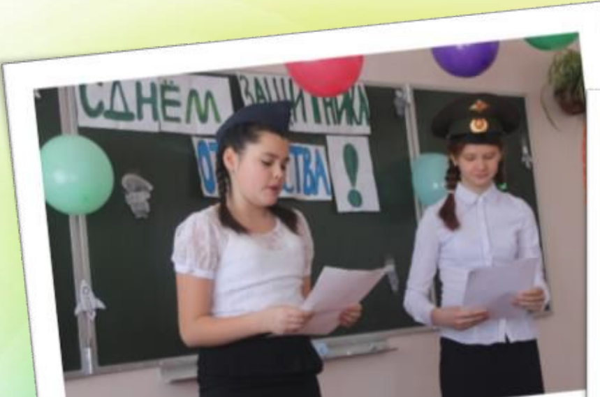
Все мероприятия беру в свои руки!