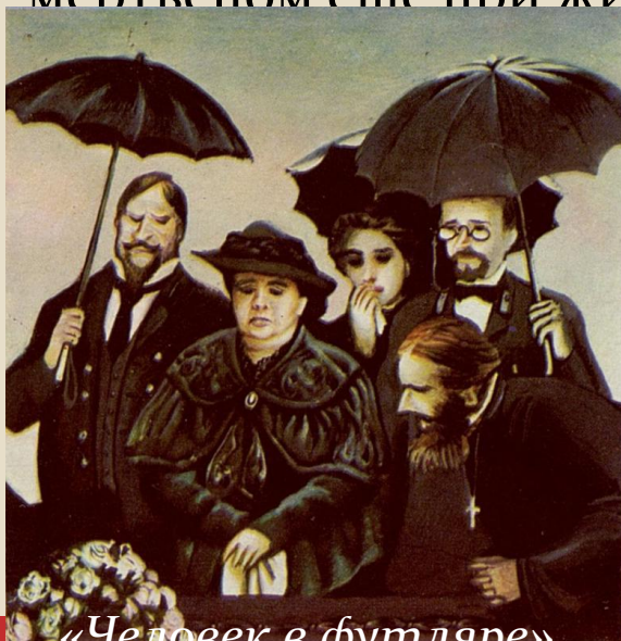
«Человек в футляре»