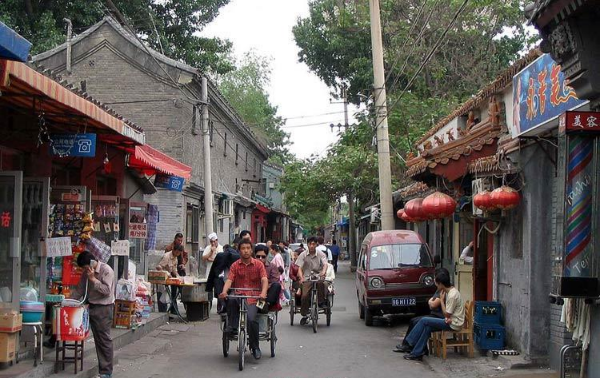
Beijing - Hutongs