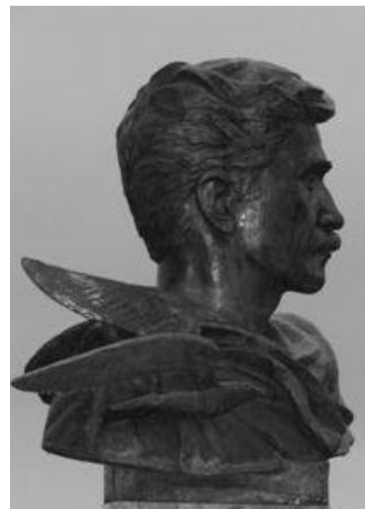
Молодой Грин. Бюст на набережной в г. Кирове