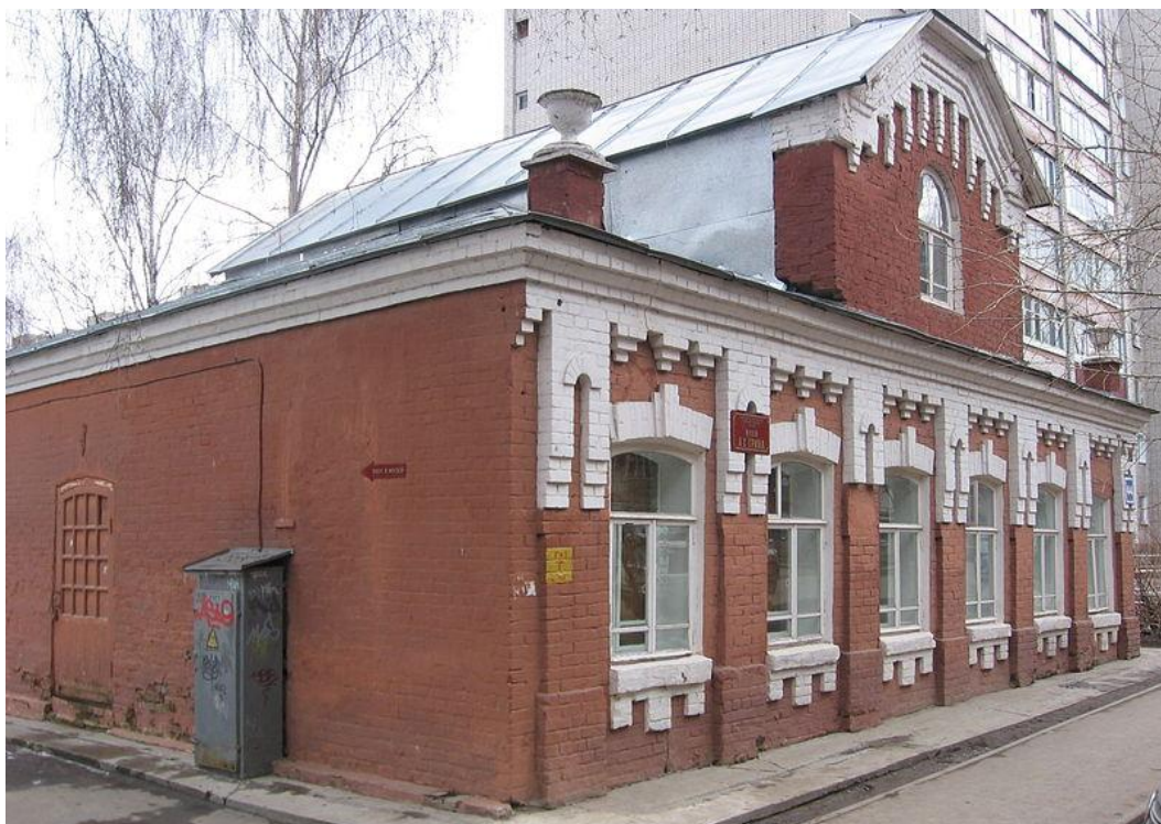
Дом-музей А. Грина г. Киров. Здесь прошло детство писателя