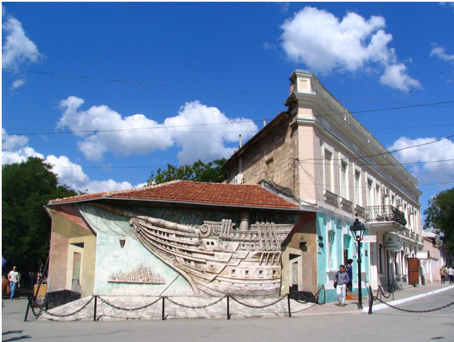
Музей А. Грина в Феодосии