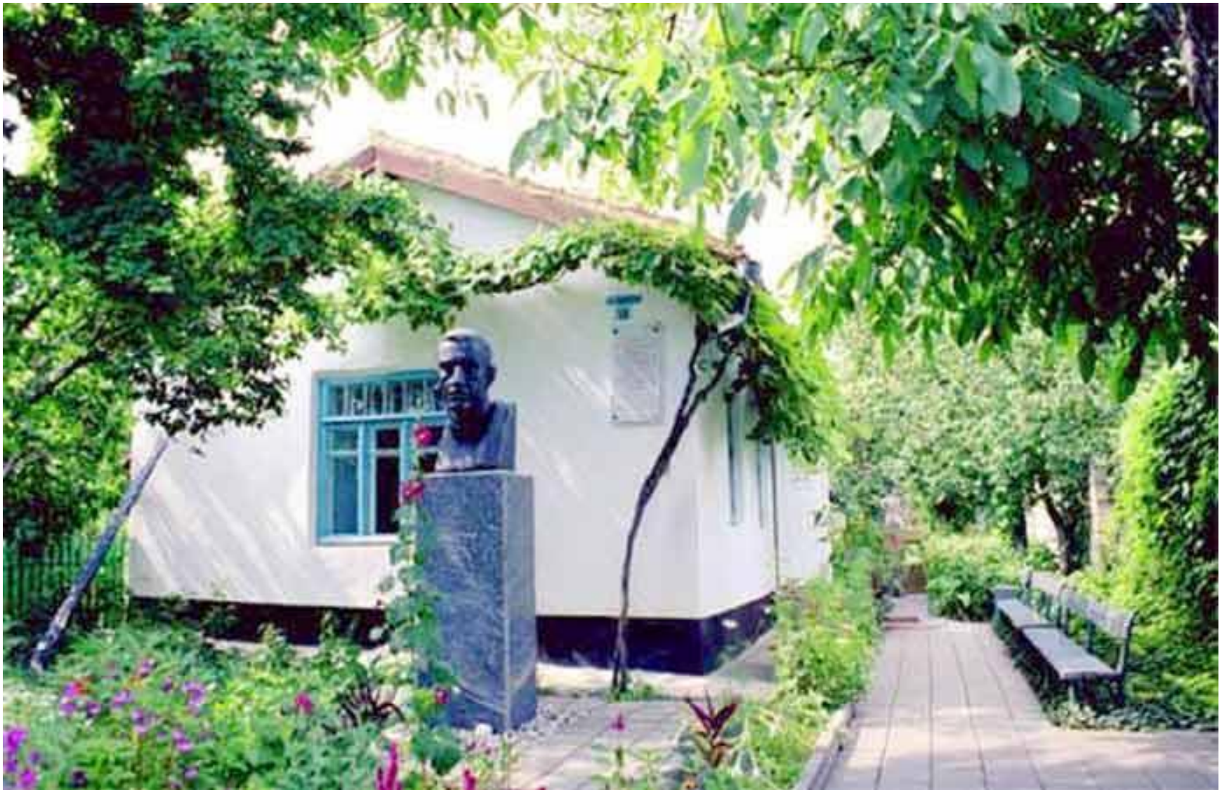
Домик А. Грина в Старом Крыму