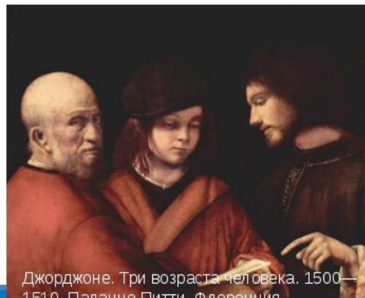
Джорджоне. Три возраста человека. 1500—1510. Палаццо Питти, Флоренция

определял возраст как относительно замкнутый период развития, имеющий собственное содержание и динамику. С его точки зрения, хронологический возраст и психологический возраст — два разных, несовпадающих понятия.