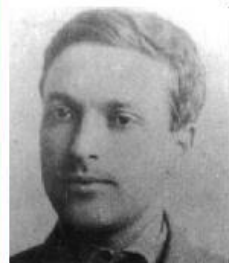
Л. С. Выготский (1832—1920 гг.)

Возраст — продолжительность периода от момента рождения живого организма до настоящего или любого другого определённого момента времени