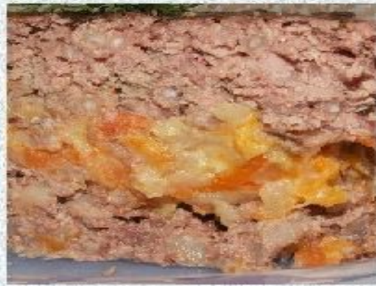
Начинка из субпродуктов