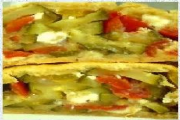
Начинка из овощей