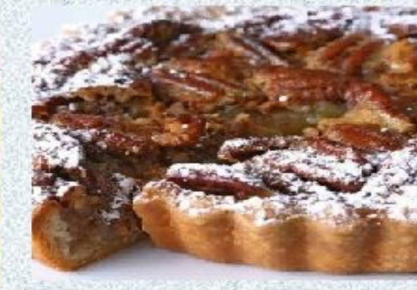
Начинка из орехов и мака