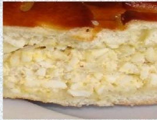
Начинка из круп, яиц