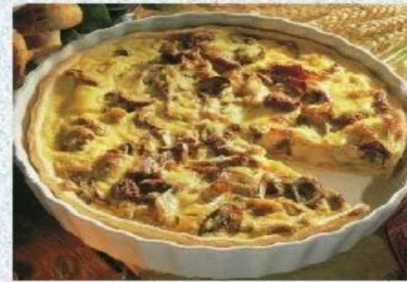
Начинка из грибов