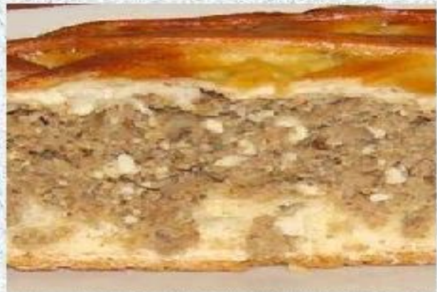
Начинка из мяса