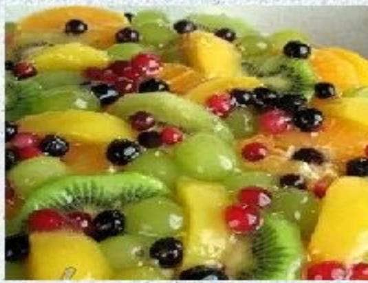
Начинка из фруктов