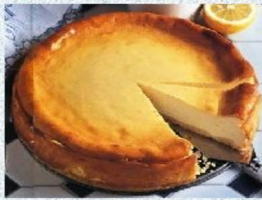
Начинка из творога