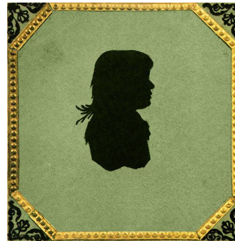
Силуэт Марии Волконской — единственное изображение матери писателя. 1810-е годы