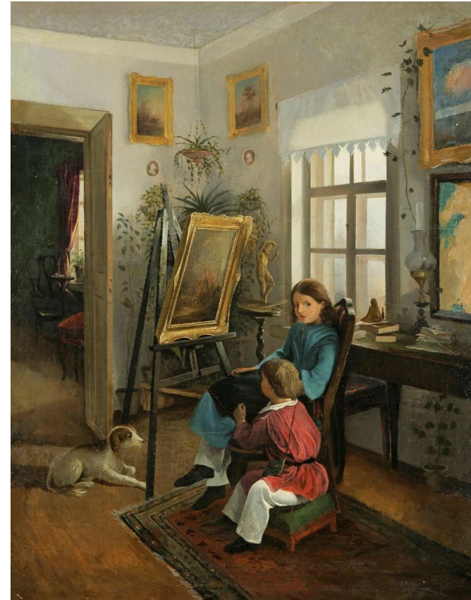
Иван Хруцкий. В комнатах усадьбы художника (Дети перед мольбертом). 1854–1855 годы. Национальный художественный музей Республики Беларусь, Минск

Для Толстого ребёнок — цельная самоценная личность, в его сознании происходит много уникального и важного. Писатель был сторонником теории Жан-Жака Руссо (человек рождается совершенным, а дальнейшее соприкосновение с действительностью и вмешательство в его характер лишь портят его).