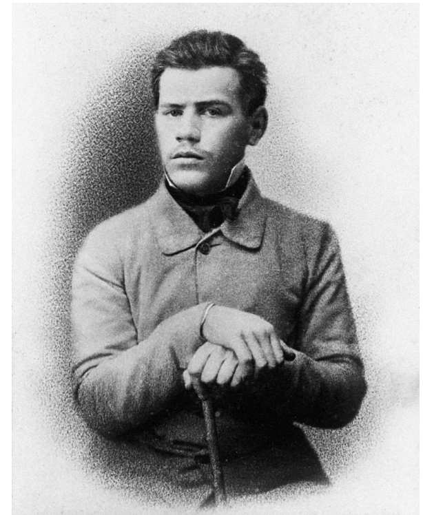
Лев Толстой. 1851 год

Толстовская трилогия родилась из дневников молодого Толстого, ищущего ответ на вопрос, как чистое непосредственное создание может превратиться в тщеславного порочного человека. Трогательный и чувствительный Николенька Иртеньев (в начале ему десять лет, в конце — шестнадцать), прообраз которого — сам Толстой, живёт обычной жизнью: неохотно учится, с удовольствием играет, сочиняет плохие стихи, впервые влюбляется, переживает смерть матери, становится неуклюжим подростком, завидует брату, поступает в университет, проваливает экзамен. Толстой рассказывает о типичной траектории взросления и пытается зафиксировать малейшие движения души, в перспективе, возможно, влияющие на всю жизнь человека.