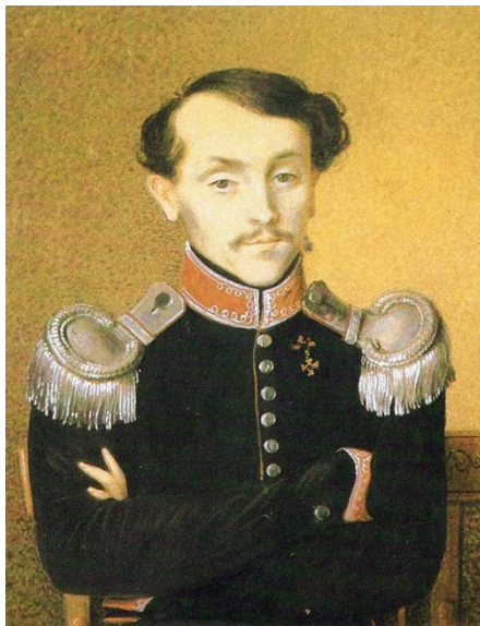
Николай Ильич Толстой, отец писателя. Неизвестный художник. 1823 год

Образ матери целиком состоит из ощущения доброты и любви, исходящих от неё, он не распадается на составляющие.