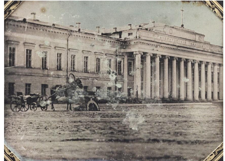
Вид на Императорский Казанский университет, где учился Толстой. 1845–1855 годы

Однако он по-прежнему пребывает в неопределённых мечтаниях и сладостных предвкушениях, и эта часть — чуть ли не самая поэтическая во всей трилогии: сон на веранде, ночные шорохи, мягкие прыжки лягушек в траве. Провал на экзаменах становится закономерным результатом этого внутреннего конфликта.