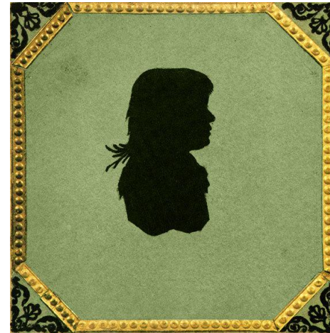
Силуэт Марии Волконской — единственное изображение матери писателя. 1810-е годы