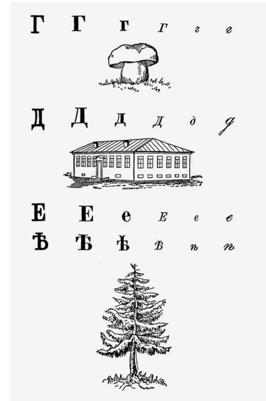
Азбука Льва Толстого. 1872 год

В трилогии Толстой изображал внутреннюю жизнь формирующегося человека, а попутно замечал, как он портится при соприкосновении с реальностью. В педагогической деятельности он поставил себе целью сохранить природную цельность и совершенство ребёнка с помощью правильного воспитания. При этом по большому счёту Толстой отрицает сам процесс воспитания, видя в нём насилие: взрослый человек за счёт своего авторитета вкладывает нужные ему знания в голову слабого ребёнка. Так что начиная с 1859 года в школе для крестьянских детей в Ясной Поляне писатель пытается создать условия, при которых возможен диалог учителя и ученика на равных.