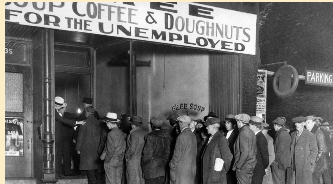
Великая депрессия 1929 - 1939 гг.

Страна вступила в полосу краха финансовой и кредитной системы, который выразился в массовой волне банкротств. За 1929–1933 гг. разорилось 135 тыс. торговых, промышленных и финансовых фирм, 5760 банков. Практически во всех отраслях промышленности наблюдалось падение производства. В результате ухудшения экономического положения в стране сократились капиталовложения в производство, что в большой степени повлияло на снижение его объемов. Промышленный кризис переплетался с аграрным. В конце 1933 г. количество безработных в США достигло 17 млн человек.