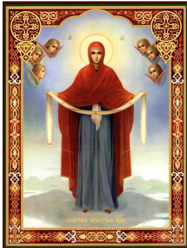
Икона — Покров Пресвятой Богородицы

ЛЕВ — родившимся с 24 июля по 23 августа, надо просить защиты у иконы — Покров Пресвятой Богородицы, а охраняют вас, ваши Ангелы-хранители: Святые Николай-угодник и Илья-пророк.