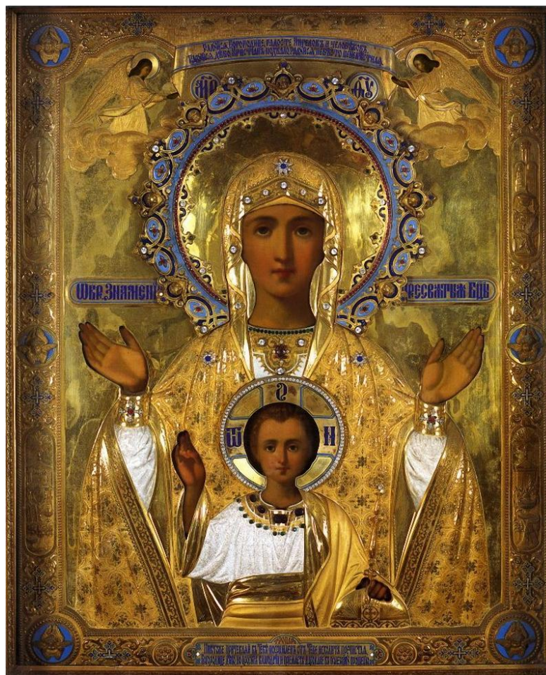
Икона Божьей Матери Знамение

СТРЕЛЕЦ — родившимся с 23 ноября по 21 декабря, должны просить заступничества у икон Божьей Матери Тихвинская и Знамение, а охраняют вас, ваши Ангелы-хранители: Святой Николай-угодник и Великомученица Святая Варвара.