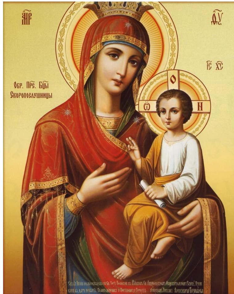
Икона — Божьей Матери Скоропослушница

СКОРПИОН — родившимся с 24 октября по 22 ноября, надо просить защины у икон Скоропослушница Божья Матерь и Иерусалимская, а охраняет вас, ваш Ангел-хранитель: Святой Павел.