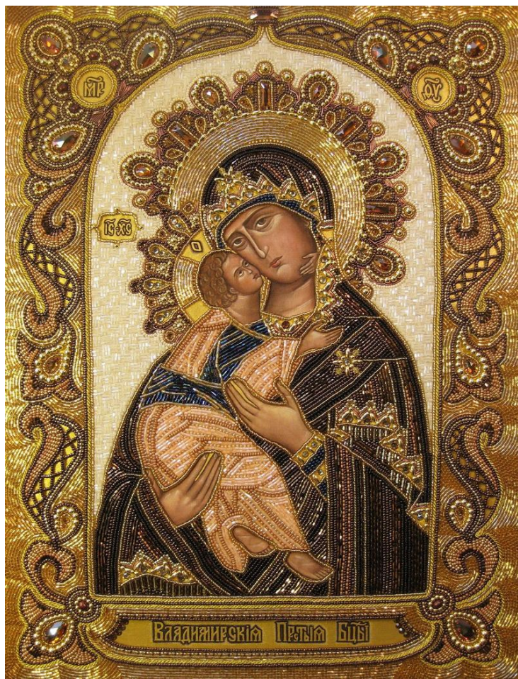
Икона Божьей Матери Владимирская

ВОДОЛЕЙ — родившимся с 21 января по 19 февраля, защитят иконы Божьей Матери Владимирская и Неопалимая Купина, а охраняют вас, ваши Ангелы-хранители: Святые Афанасий и Кирилл Александрийские