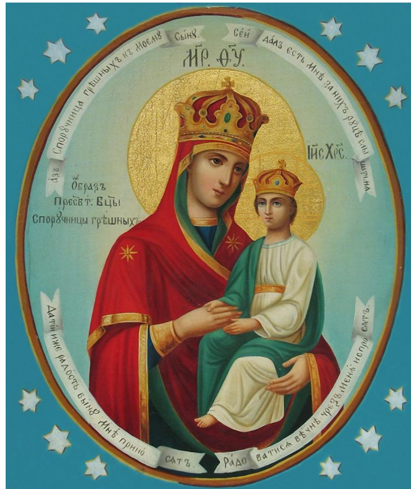
Икона Божьей Матери — Споручница грешных

ТЕЛЕЦ — родившимся с 21 апреля по 21 мая надо просить защиты у икон Споручница грешных (в простонародии называемая часто как Спорушница) — Поручительница за грешников, Заступница и Помощница всех раскаявшихся в своих грехах. Иверская икона