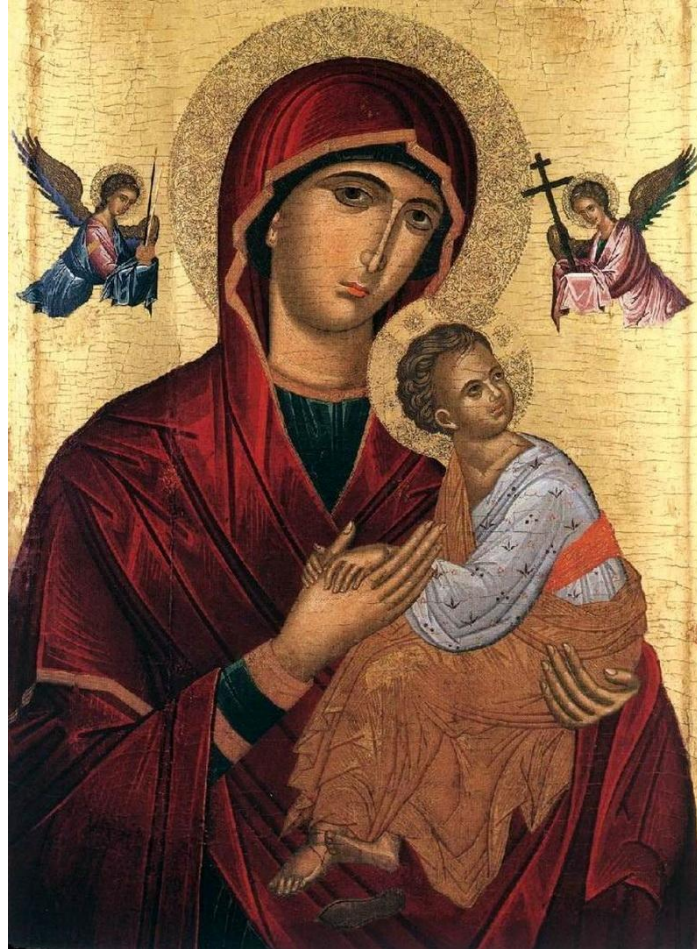
Икона — Страстная

ДЕВА — родившимся с 24 августа по 23 сентября , надо просить защиты у икон — Неопалимая Купина и Страстная, а охраняют вас, ваши Ангелы-хранители: Святые Александр, Иоанн, Павел.