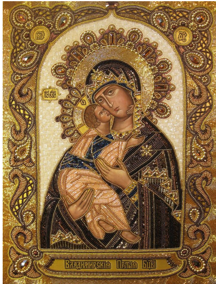
Икона Божьей Матери Владимирская

ВОДОЛЕЙ — родившимся с 21 января по 19 февраля, защитят иконы Божьей Матери Владимирская и Неопалимая Купина, а охраняют вас, ваши Ангелы-хранители: Святые Афанасий и Кирилл Александрийские