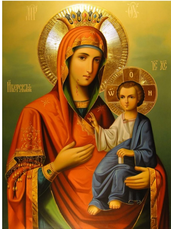
Икона Божьей Матери Иверская

РЫБЫ — родившимся с 20 февраля по 20 марта, должны просить заступничества у иконы Иверской Божьей Матери, а охраняют вас, ваши Ангелы-хранители: Святые Алексей и Милентий Антиохийский.