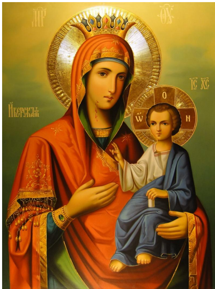
Икона Божьей Матери Иверская

РЫБЫ — родившимся с 20 февраля по 20 марта, должны просить заступничества у иконы Иверской Божьей Матери, а охраняют вас, ваши Ангелы-хранители: Святые Алексей и Милентий Антиохийский.