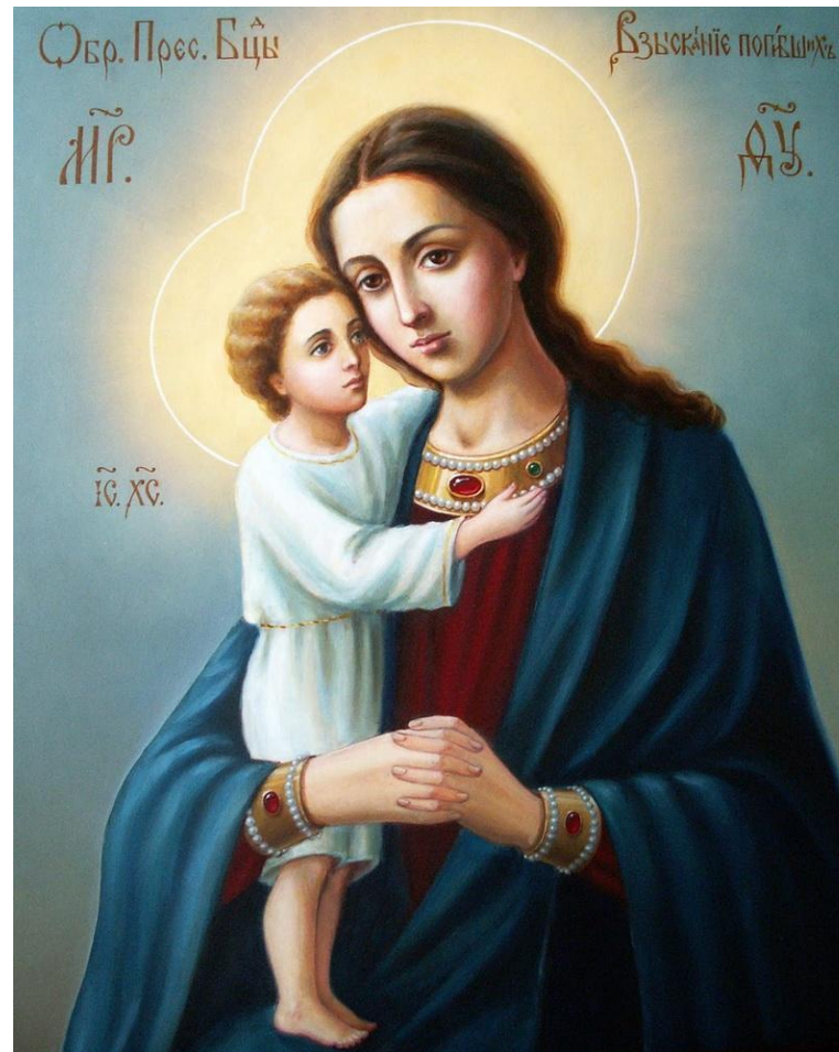
Икона — Взыскание погибших

БЛИЗНЕЦЫ — родившимся с 22 мая по 21 июня, надо просить защиты у икон Богоматери «Взыскание погибших», «Неопалимая Купина» и Владимирская икона Божьей Матери, а охраняют вас, ваши Ангелы-хранители: Святые Алексей Московский и Константин.