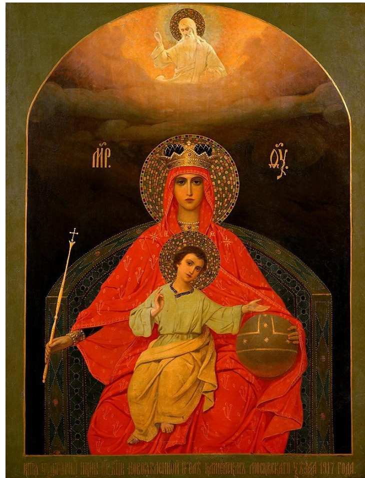
Икона Божьей Матери Державная

КОЗЕРОГ — родившимся с 22 декабря по 20 января, защитит икона Божьей Матери Державная, а охраняют вас, ваши Ангелы-хранители: Святые Сильвестер и Преподобный Серафим Саровский