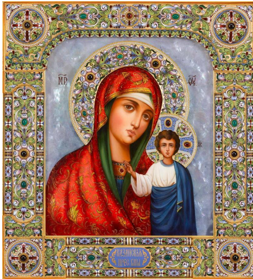
Икона Божьей Матери — Казанская

ОВЕН — родившимся с 21 марта по 20 апреля надо просить защиты у иконы Казанской Божьей Матери, а охраняют вас, ваши Ангелы-хранители: Софроний Врачанский, Святые Софроний и Иннокентий Московские, Святой Георгий — исповедник.