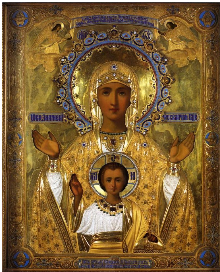
Икона Божьей Матери Знамение

СТРЕЛЕЦ — родившимся с 23 ноября по 21 декабря, должны просить заступничества у икон Божьей Матери Тихвинская и Знамение, а охраняют вас, ваши Ангелы-хранители: Святой Николай-угодник и Великомученица Святая Варвара.