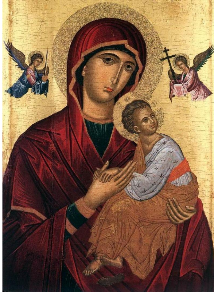
Икона — Страстная

ДЕВА — родившимся с 24 августа по 23 сентября , надо просить защиты у икон — Неопалимая Купина и Страстная, а охраняют вас, ваши Ангелы-хранители: Святые Александр, Иоанн, Павел.