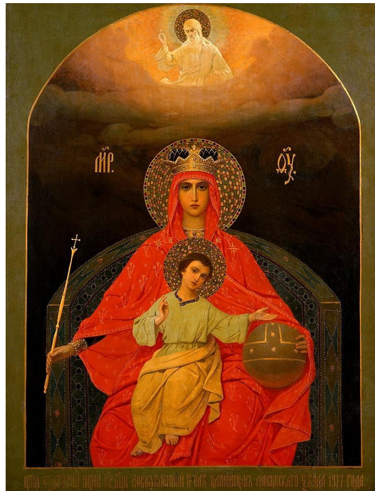
Икона Божьей Матери Державная

КОЗЕРОГ — родившимся с 22 декабря по 20 января, защитит икона Божьей Матери Державная, а охраняют вас, ваши Ангелы-хранители: Святые Сильвестер и Преподобный Серафим Саровский