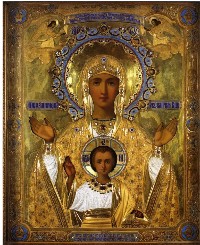
Икона Божьей Матери Знамение

СТРЕЛЕЦ — родившимся с 23 ноября по 21 декабря, должны просить заступничества у икон Божьей Матери Тихвинская и Знамение, а охраняют вас, ваши Ангелы-хранители: Святой Николай-угодник и Великомученица Святая Варвара.