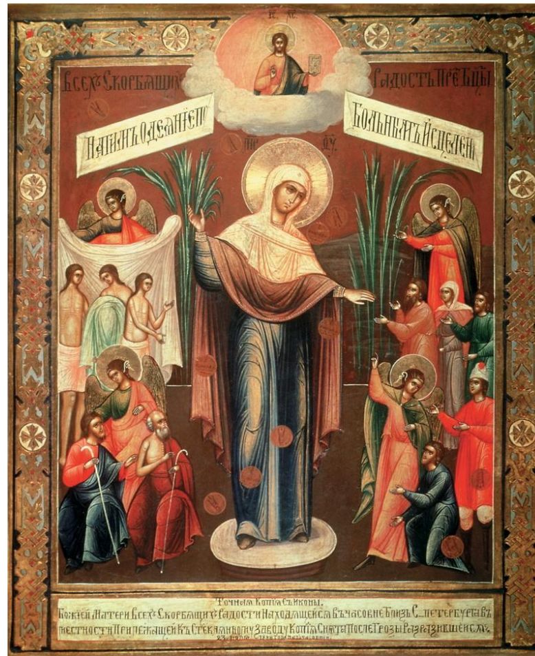
Икона Божьей Матери — Всех скорбящих радость

РАК — родившимся с 22 июня по 23 июля, надо просить защиты у икон Богородица всех скорбящих радость и Казанской Божьей Матери, а охраняет вас, ваш Ангел-хранитель: Святой Кирилл.