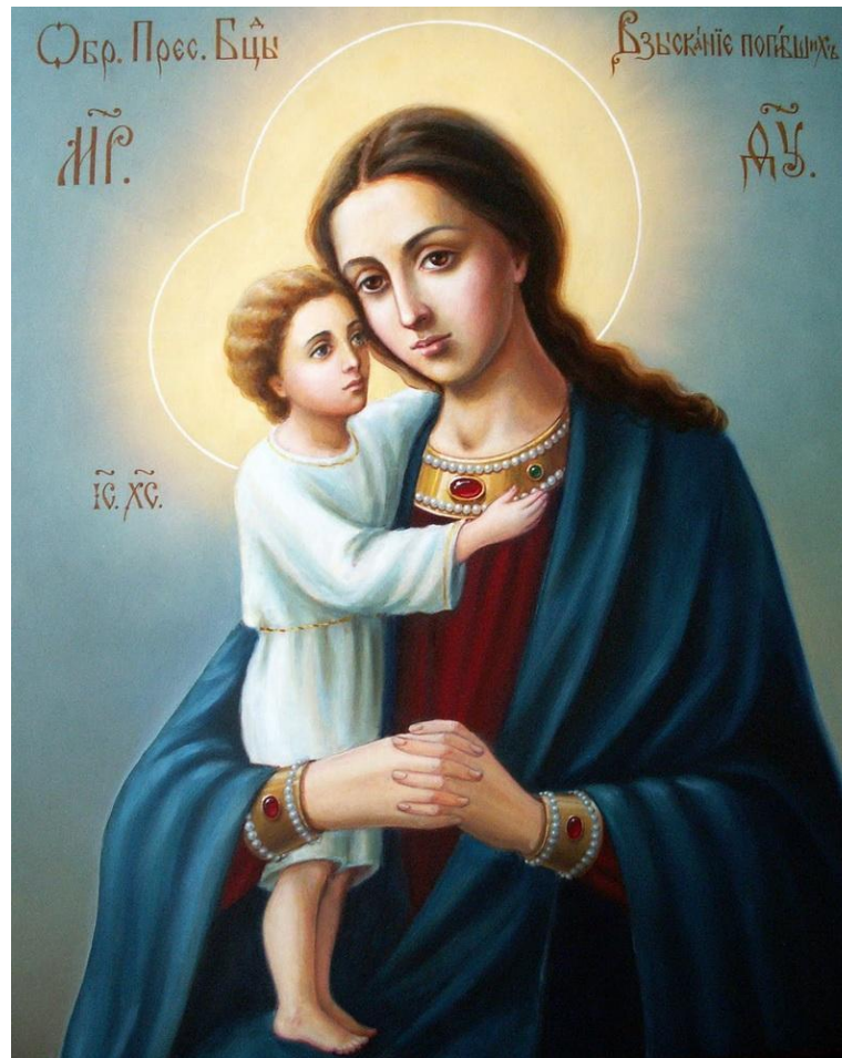
Икона — Взыскание погибших

БЛИЗНЕЦЫ — родившимся с 22 мая по 21 июня, надо просить защиты у икон Богоматери «Взыскание погибших», «Неопалимая Купина» и Владимирская икона Божьей Матери, а охраняют вас, ваши Ангелы-хранители: Святые Алексей Московский и Константин.