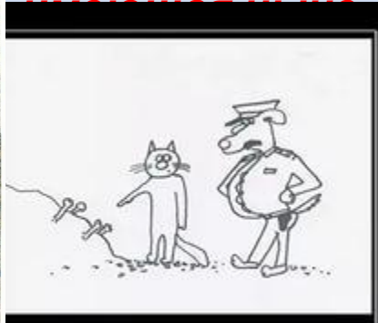
Вот где собака зарыта!