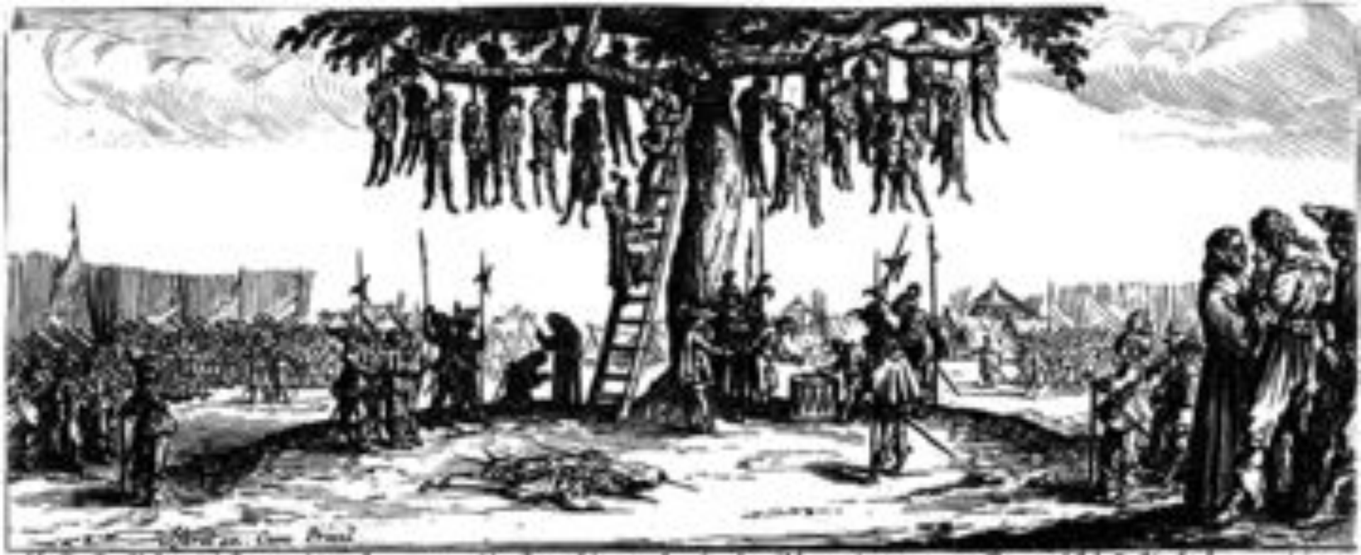
Malheur des Voleurs infames et perdus Comme fraude malheureux à cet arbre pendus

Результатом війни стало упокорення Чехії: імперський військовий трибунал стратив понад 600 представників чеської