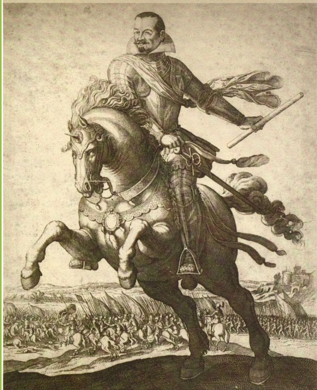
ALBERTVS D.G.DVX FRIDLANDIAE SAC. 2 CAES. 2 MA. 2 CONSILIARI BELLIC. CAMERARI, SVPREM. COLONELL, PRAGENSIS. ET EIVSDEM MILITIAE GENERALIS

Альбрехт Венцель Ойзебіус фон Вальдштейн, відоміший як Валленштейн— герцог Фридландський та Мекленбурзький, князь Саганський, генералісимус, один з головнокомандувачів військ Священної Римської Імперії під