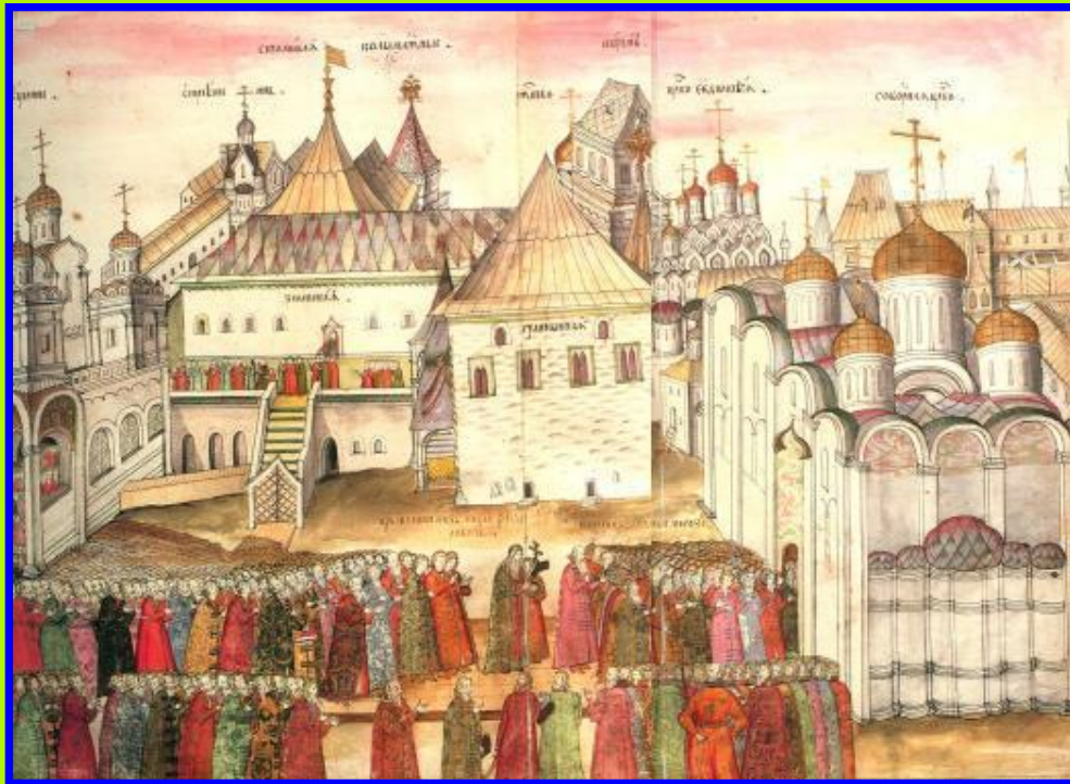
Освещение Благовещенского собора Кремля в 1489 г.

Православная Церковь всеми силами поддерживала объединение земель вокруг Москвы, великокняжескую власть и создание централизованного государства. Благодарные князья предоставляли Церкви земельные владения, налоговые льготы, жертвовали значительные суммы денег.