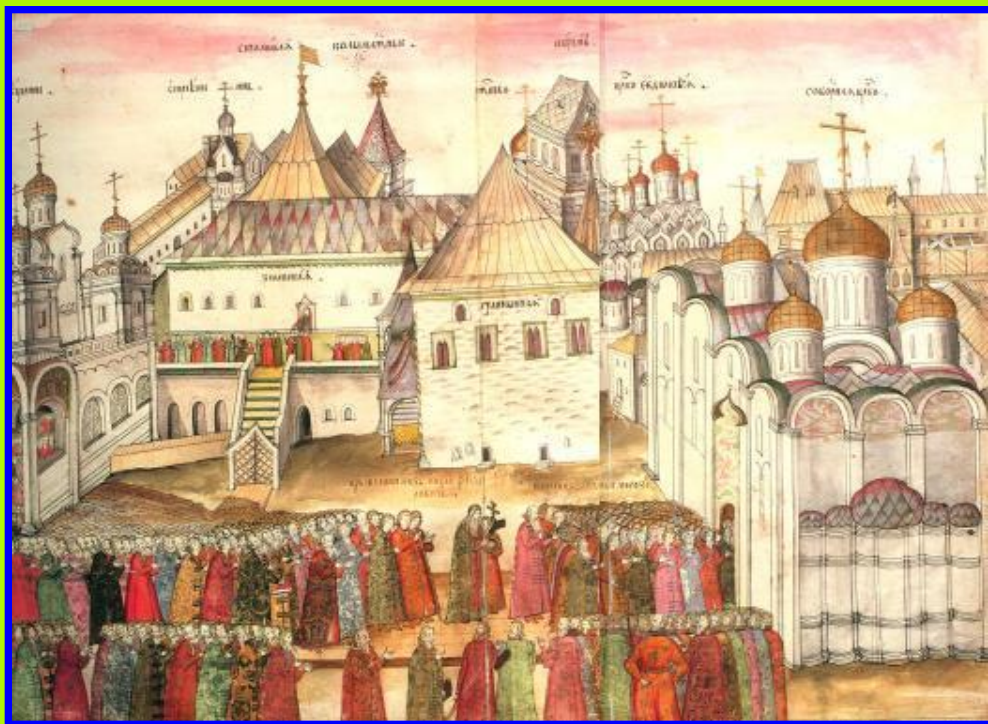
Освещение Благовещенского собора Кремля в 1489 г.

Православная Церковь всеми силами поддерживала объединение земель вокруг Москвы, великокняжескую власть и создание централизованного государства. Благодарные князья предоставляли Церкви земельные владения, налоговые льготы, жертвовали значительные суммы денег.