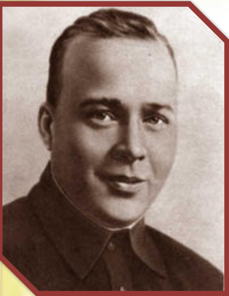
Аркадий Петрович Гайдар (Голиков) (1904 -1941)