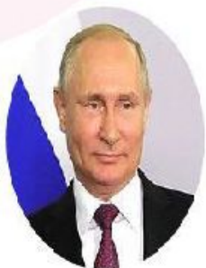
ПУТИН ВЛАДИМИР ВЛАДИМИРОВИЧ