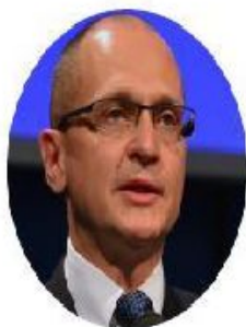
КИРИЕНКО СЕРГЕЙ ВЛАДИЛЕНОВИЧ