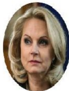
ГОЛИКОВА ТАТЬЯНА АЛЕКСЕЕВНА