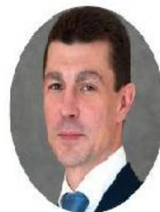
ТОПИЛИН МАКСИМ АНАТОЛЬЕВИЧ