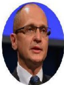
КИРИЕНКО СЕРГЕЙ ВЛАДИЛЕНОВИЧ