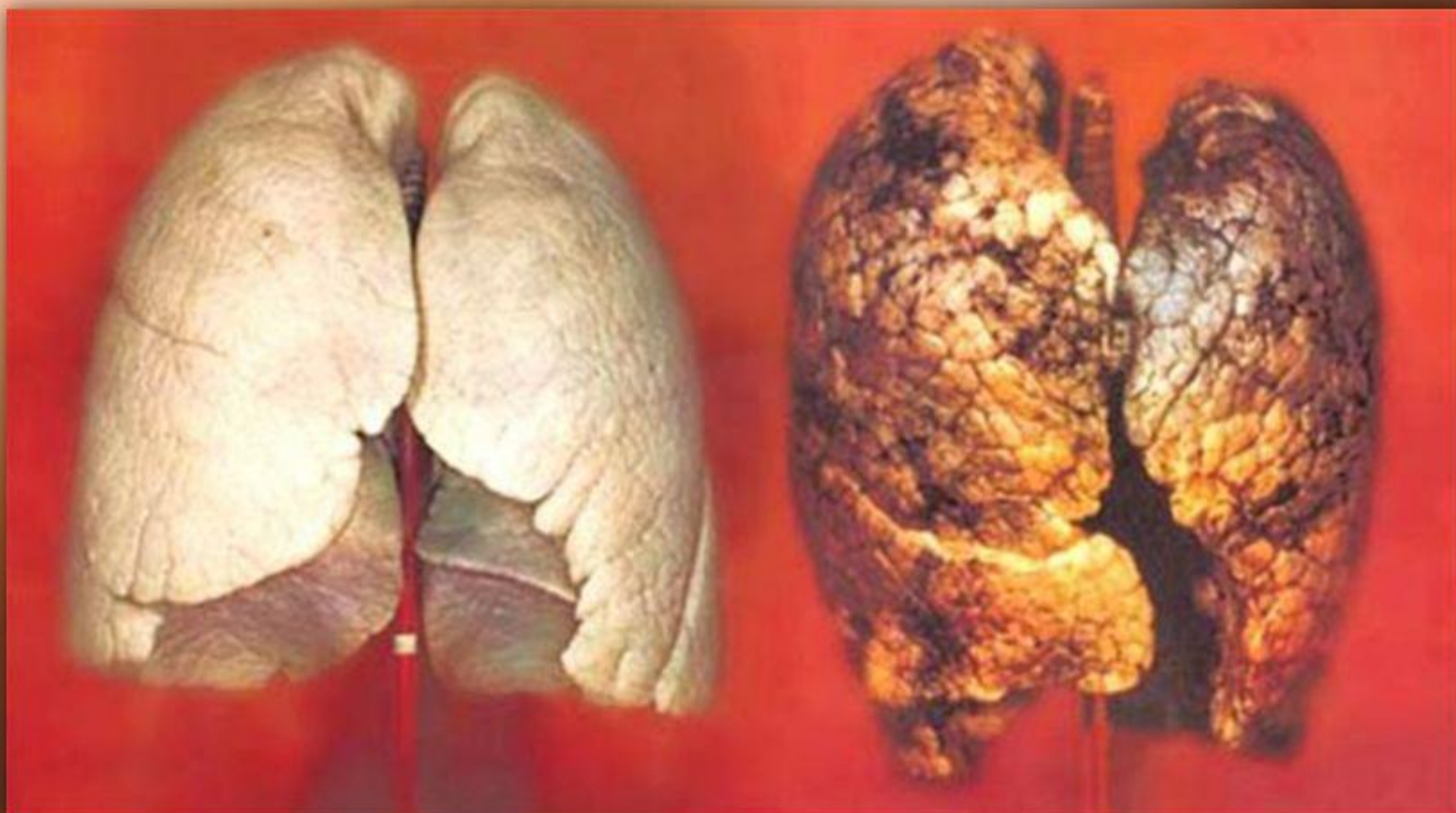
Лёгкие здорового человека