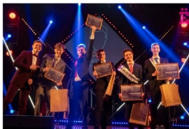
Студенческий дворец культуры

Дополнительную информацию о конкурсе можно найти в группе конкурса в социальной сети «ВКонтакте».