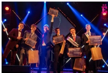
Студенческий дворец культуры

Дополнительную информацию о конкурсе можно найти в группе конкурса в социальной сети «ВКонтакте».